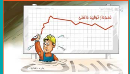
تولید داخلی و وارداتی رویه