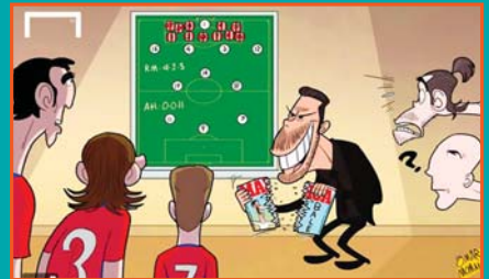
سیستم اتلتیکومدیر در میان