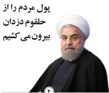
پول مردم را از حقوق دزدان بیرون می کشیم