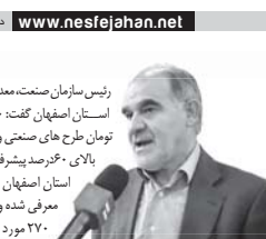
رئیس سازمان صنعت، معدن و تجارت اصفهان گفت: ۴۶ میلیارد تومان طرح های صنعتی و کشاورزی بالای ۶۰۰۰ خردصنعتی طرح های در اصفهان به بانک ها معرفی شده و سه هزار و ۲۷۰ مورد ثبت نام در