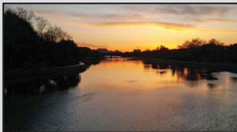
آب و آسمان (غروب پل فلزی) | مجتبی طباطبایی