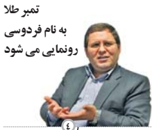
تمیر طلا به نام فردوسی رونمایی می شود