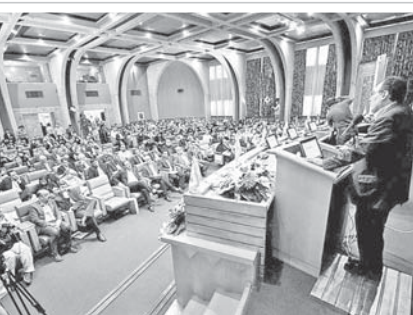
اسکان سازان ایزده

رئیس سازمان صنعت، معدن و تجارت استان اصفهان با بیان اینکه تاکنون ۴۵