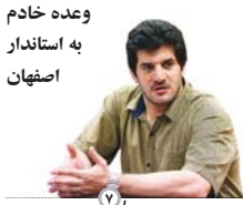
وعده خادم به استاندار اصفهان