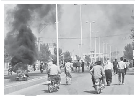
بررسی پرونده بلداجی

بروجن به چناخور و از آنجا به بروجن منتقل می‌گشت. طبق گفته مدیرعامل شرکت آب منطقه‌ای استان چهارمحال و بختیاری هدف از اجرای این طرح انتقال