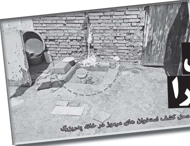
محل کشف استخوان های مرده در خانه پدری وی

پیدا شدن جسد های آهک ریخته شده دو کودک آبادانی در حیاط خانه پدریزک، معمایی پیچیده‌ای را پیش روی مأموران قرار داده است.