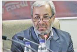
رئیس شورای هماهنگی تبلیغات اسلامی استان اصفهان در نشست خبری با خبرنگاران.

«روز پنج شنبه (امروز) ۱۱ شهید گلگون کفن دوران دفاع مقدس در اصفهان تشییع می شوند» رئیس شورای هماهنگی تبلیغات اسلامی استان اصفهان در نشست خبری با خبرنگاران با حضور مدیرمسئول و مدیرعامل این رسانه گفت: «ما در این روزها با روحیه و جسارتی که در روزهای دفاع مقدس داشتیم، امروز باید با همان روحیه و جسارت، در راه دفاع از ارزش‌های انقلاب و نظام جمهوری اسلامی ایستادگی کنیم» رئیس شورای هماهنگی تبلیغات اسلامی استان اصفهان در این نشست خبری با خبرنگاران گفت: «ما در این روزها با روحیه و جسارتی که در روزهای دفاع مقدس داشتیم، امروز باید با همان روحیه و جسارت، در راه دفاع از ارزش‌های انقلاب و نظام جمهوری اسلامی ایستادگی کنیم» رئیس شورای هماهنگی تبلیغات اسلامی استان اصفهان در این نشست خبری با خبرنگاران گفت: «ما در این روزها با روحیه و جسارتی که در روزهای دفاع مقدس داشتیم، امروز باید با همان روحیه و جسارت، در راه دفاع از ارزش‌های انقلاب و نظام جمهوری اسلامی ایستادگی کنیم»