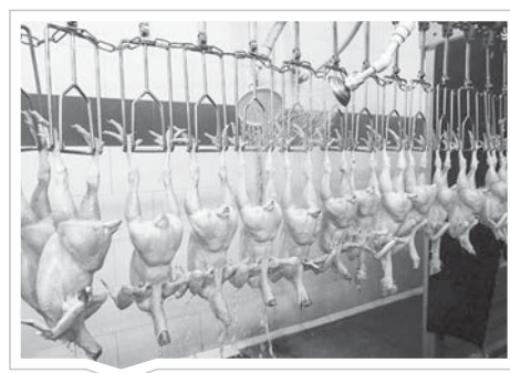
از قیمت گران مرغ تا مواد سطرانی

شهرهای قم، خوارسار، خمین، گلپایگان، محلات، نیمور و سلفچگان به طور رسمی به بهره‌برداری می‌رسد. خسرو ارتقایی گفته‌اند: هدف از اجرای این طرح، انتقال ۱۸۲ میلیون متر مکعب آب در سال از سرشاخه‌های ذی‌بند کوجرجی به هدف تأمین آب شرب شهرهای قم، خوارسار، خمین، گلپایگان، محلات، نیمور و سلفچگان و نیز تخصیص مقادری از آب انتقال یافته به صنعت است. طرح انتقال آب از سرشاخه‌های ذی‌بند قمرود سه بخش عمده تولید های اصلی انتقال و آبگیرها، سد کوجرجی و خط لوله آبرسانی تشکیل شده و سیستم انتقال