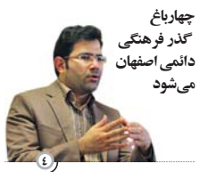
چهارباغ گذر فرهنگی دائمی اصفهان می شود