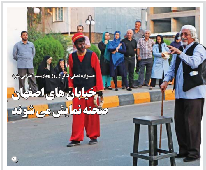
چشواره فصلی تاتار از روز چهارشنبه آغاز می شود