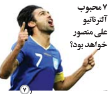
۷ محبوب آترناتیو علی منصور خواهد بود؟