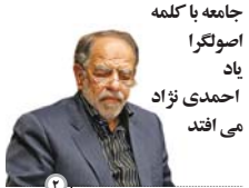
جامعه با کلمه اصولگرا یاد احمدی نژاد می افتد