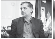
تورر بیولوژیک «طالب زاده، نوباوه و دادمان» اثبات نشند