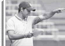
خبر خوشحال‌کننده «بیلد» برای فوتبالدوستان

بعد از کسب ۴ امتیاز از سه بازی، مسئولان باشگاه وردربرمن تصمیم گرفتند قرارداد الکساندر نوری را به صورت دائمی تا انتهای فصل ثبت کنند. الکساندر که حالا اولین مربی تاریخ بوندسلیگای یک است، به نوشته روزنامه بیلد جای موفقیت نسبی با تیمش روی نوشته مانده‌نگار می‌شود و مسئول نجات برمن خواهد بود. تتها دو هفته پس از اینکه از «تیم ب» به تیم اصلی وردربرمن کوچ کرد، موفق شد اول برد تیش را به شکلی دراماتیک کسب کند. او این هفته هم توانست با نتیجه ۲ بر ۲ بازی خارج از خانه، امتیاز چهارم برمن