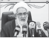
داستان‌ها و پلیس باقمه زنی برخورد کنند