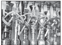
عرضه کلیان با روش «فست دوی» در اصفهان