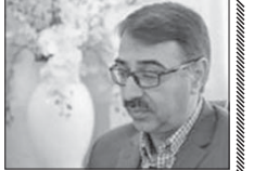
۱۷۰۰ زندانی جرائم غیر عمد استان آزاد شدند

رئیس شوراهای حل اختلاف استان اصفهان گفت: یکسال گذشته نزدیک ۱۷۰۰ زندانی جرائم غیر عمد استان اصفهان آزاد شدند.