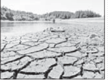
اضافه برداشت ۴۰۰ میلیون متر مکعبی آب در استان

رئیس شوراهای حل اختلاف استان اصفهان گفت: یکسال گذشته نزدیک ۱۷۰۰ زندانی جرائم غیر عمد استان اصفهان آزاد شدند.