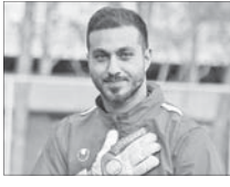
سوسا در لیگ حرفه ای؟

بعد از دو سال ضعیف و پرحاشیه در پرسپولیس، غیر قابل پیش بینی ترین سرتوشت برای سوسا مکانی حضور در فوتبال نوروژ و بازی در ترکیب اصلی تیم ملی بود. مکنکی در نوروژ کمتر از دوران حضور در پرسپولیس اشتباه نمی کرد اما حضور ناآشناش در یک تیم اروپایی باعث شد کیروش او را به حقیقی، اخباری و مظهاری ترجیح بدهد و در ترکیب اصلی تیم ملی بگذارد. میونان فصل پیش در رده ششم لیگ دسته دوم نوروژ قرار گرفت و به پلی اف حضور در لیگ حرفه ای رسید. باخت دو یک به نوروژ، رویای صعود آن ها را به باد داد.