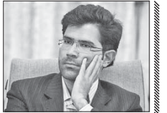
طرح زوج و فرد شکست نخورده است

معاون حمل و نقل و ترافیک شهری شهرداری اصفهان گفت: طرح زوج و فرد را طریح به بن بست رسیده و شکست خورده نمی داند، بلکه یک طرح تسکین دهنده ای بود که در مقدمه برای کاهش آلودگی هوا و به سبب کاهش تردد در شهر انجام شد.