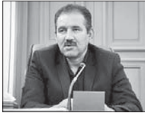
رشد ۶۰ درصدی ورود گردشگران به اصفهان

معاون حمل و نقل و ترافیک شهرداری اصفهان در نشست تخصصی و طرح زوج و فرد را طریح به بن بست رسیده و شکست خورده نمی داند، بلکه یک طرح تسکین دهنده ای بود که در مقدمه برای کاهش آلودگی هوا و به سبب کاهش تردد در شهر انجام شد.