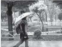
آغاز موج جدید بارش ها از هفته آینده

معاون امور توانبخشی سازمان بهزیستی گفت: روند جذب نیرو معلول در ادارات دولتی متوقف شده و طی ۱۵ سال اخیر حتی یک معلول نیز جذب این ادارات نشده است. حسین نحوی سرگاز گفت: در هر منطقه ای که آمار بیکاری اعلام می شود این آمار در بین قشر معلول بسیار قابل توجه تر است. وی افزود: آمار بیکاری در هر منطقه باید ضرب در عدد معلولین تا از این طریق بتوان به آمار بیکاری در قشر معلول پی برد.