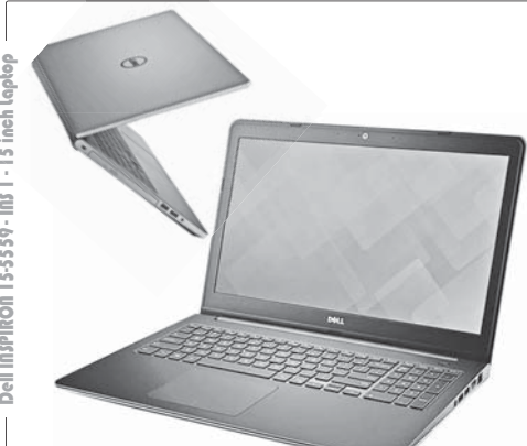
Dell INSPIRON 15-5559-INS-1 15 inch laptop

روزانه خود مثل وگ‌بگردی، تماشا می‌فایم، بازی‌های هنر چندان سنگین و کار با آفیس و سایر کارها را به راحتی انجام دهید. پردازنده گرافیکی AMD Radeon R5 ۱M335 با حافظه اختصاصی ۴ گیگابایت امکان انجام کارهای گرافیکی را تا حد مناسبی فراهم می‌کند. صفحه‌نمایش این لپ‌تاپ ۱۵.۶ اینچ و روکش آن برای است، مناسب است. صفحه‌نمایش‌های سبک در محیط‌های با نور زیاد به دلیل انکسار کم و بعد از کار کردن طولانی ممکن است باعث خستگی چشم شوند. رابط‌های کاربری این دستگاه از تنوع نسبتاً خوبی برخوردار است و ۱ پورت USB 3.0، دو پورت USB 2.0 و پورت HDMI دارد. با توجه به مشخصات سخت‌افزاری و ویژگی‌های گرفته شده، این لپ‌تاپ در رده کاربری عمومی قرار می‌گیرد. باتری آن ۴ سلولی و توان شارژدهی ۵ تا