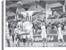
مبارزه اصفهانی ها در هفته سوم لیگ برتر هندبال

دو تیم شهرداری کاشان و ارومیه در هفته سوم از مصاف هم می روند که تیم شهرداری کاشان از هشت ملی پوش و تیم شهرداری ارومیه از دو بازیکن خارجی بهره می برد. شهرداری در حالی در کاشان میزبان نماینده آذربایجان غربی است که در صورت پیروزی عنوان دومی جدول را برای خود حفظ خواهد کرد. در پایان هفته دوم این رقابتها تیم نفت و گاز جسران با ۴ امتیاز در رده اول قرار دارد. شهرداری کاشان با ۳ امتیاز دوم و شهرداری ارومیه با دو امتیاز سوم است. مس کرمان هم با دو امتیاز و تفاضل گل کمتر در رده چهارم قرار دارد.