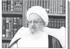
هدف بنیانگذاران دانشگاه جدایی علم از دین بوده است

حضرت آیت. ام. مکارم شیرازی گفتند: کتاب‌هایی که جنبه ترجمه دارند و در دانشگاه‌ها تدریس می‌شوند را با قوت برمی‌داریم و فرهنگ غربی و سکولار که در آنها گنجانده شده است را حذف کنیم.