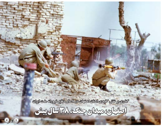
گفتگو و تفتیش کیبندی اشخاص اشخاص در ۸ سال دفاع هیئت های طبه لویان اصفهان و دیدن چنگ ۳۸ سال پیش