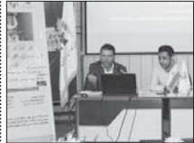
۴۶۰ بیمه شده روستایی در اصفهان بازنشسته شدند

مدیر صندوق بیمه اجتماعی کشاورزان، روستاییان و عشایر استان اصفهان با بیان اینکه افراد زیر پوشش این صندوق پس از ۱۵ سال سابقه بیمه بازنشسته می شوند، خاطر نشان کرد: برای دریافت کامل مستمری ماهانه همه افراد زیر پوشش توصیه می کنیم که سابقه بیمه را تکمیل کنند. استکی جمعیت زیر پوشش صندوق بیمه اجتماعی کشاورزان، روستاییان و عشایر استان اصفهان را ۷۱ هزار نفر اعلام کرد و گفت: مردم در روستاها، عشایر و شهرهای زیر ۲۰ هزار نفر استان که بیمه نیستند، می توانند زیر پوشش این صندوق قرار گیرند.