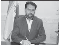
امر به معروف نشانه غیرت دینی است

معاونت فرهنگی و اجتماعی و مدیر فرهنگسرای غدیر شهرداری فلاورجان، اظهار کرد: امر به معروف و نهی از منکر بازنهترین و گرامی ترین واجب در بین واجبه است و هدف تمام انبیا و اولیای الهی اصلاح جامعه بشری بوده است و مؤثرترین اثر برای رسیدن به این هدف والا امر به معروف و نهی از منکر است. امین الهی رهنما اضافه کرد: قرآن کریم به کرات به اهمیت این فریضه اشاره کرده و امر به معروف و نهی از منکر را از منکر از صالحان، رستگاران و بهترین امت می داند. وی خاطرنشان کرد: در بسیاری از روایات، امر به معروف و نهی از منکر سبب امتیاز