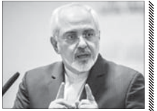
زرفیاف: دیدارهای من با کری اعلام‌نشده نبود

دینی چندانی نداشته باشند. در عین حال نمی‌شود منکر وجود دانشگاه در کشور شد؛ چرا که علم از ضروریات است و هرگز نمی‌توان دانشگاه را حذف کرد. اما باید مشکلاتش را اصلاح کرد.