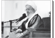
تخریم کنندگان عاشورا و عزاداری، احمق هستند

کتابخانه | همزمان با ورود «دونالد ترامپ» به نیویورک به منظور شرکت در نشست سالانه مجمع عمومی ملل متحد، شدیدترین ترتیبات امنیتی از سوی سرویس مخفی محافظت از او به مورد اجرا گذاشته شده است. سرویس مخفی آمریکا ده ها کامیون حامل شن و ماسه را در اطراف محل اقامت ترامپ مستقر کرده و علاوه بر آن تیم‌های همبسی ۲۴ ساعته با استفاده از سگ ها و دستگاه‌های پیشرفته اسکن، امکان ورود و خروج هر شیئی مشکوکی را به هتل محل اقامت ترامپ بازرسی می کنند.