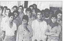
مدیر روابط عمومی «وچ» ضمن تکذیب تماس سازمان