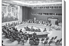
مکویت حادثه تروریستی اهواز توسط شورای امنیت

شورای امنیت سازمان ملل دوله شنبه به وقت محلی نیویورک با صدور بیانیه‌ای حمله تروریستی به رژه نظامی اهواز را محکوم کرد. براساس این بیانیه، اعضای شورای امنیت به شدت مدعی و چون به حملات تروریستی شیع و بزلاته در جمهوری اسلامی ایران، در اهواز در تاریخ ۳۱ شهریور را محکوم کردند. اعضای شورای امنیت عمیق ترین مراتب همدردی و تسلیت را به خانواده قربانیان و به دولت جمهوری اسلامی ایران بیان کرده و آرزو کردند که مجروحین به سرعت بهبود کامل یابند. اعضای شورای امنیت ضرورت پاسخگویی به مرتکبین و حامیان این اقدامات تروریستی نکوهیده و ابرودن آنها به پیشگاه عدالت