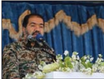
ارتش، نماد اسلام‌خواهی، میهن‌وستی و قدرت

استاندار اصفهان گفت: زبیر نبوتی هوایی از تش در مناطقی که آشوب‌طلبان می‌خواستند ضربه ایجاد کنند، قدرتمندانه ایستادگی کرده و طومار دشمنان را اسلام‌خواهی، میهن‌وستی و قدرت است که در همه روز ارتش اظهار کرده، نه فقط بعد از انقلاب، بلکه در زمان تجزیر و جنگ علیه ایران نیز این ارتش، سپاه و نیروهای درمی‌یابند که در برابر تهاجم دشمن