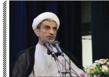
۹۹ درصد اراضی ملی در اصفهان سنددار شد

رئیس کل دادگستری اصفهان گفت: در صد از اراضی زمین در استان سنددار شده‌اند، اما این طرح در مورد زمین‌های ادارات دولتی و اراضی کشاورزی با نقطه مطلوب فاصله زیادی دارد. جنت‌الاسلام، مسجد، جعفری در اولین نشست اسماش شورای حفظ حقوق بیت‌المال با برنامه دستگاف قضایی استان برای اجرای کامل طرح سنددار کردن اراضی (کاداستر) در سال جدید خبر داد و تأکید کرد: ۹۹ درصد از اراضی ملی در استان اصفهان سنددار شده‌اند، اما این طرح در خصوص زمین‌های ادارات دولتی و همچنین اراضی کشاورزی با نقطه مطلوب فاصله زیادی دارد.