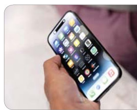
کاهش روشنایی صفحه نمایش در شب می‌تواند به خواب بهتر کمک کند.

اگر نمی‌خواهید رنگ‌های گوشی خود را کمتر گرم کنید، راهی دیگر کم کردن صفحه نمایش وجود دارد. در این برنامه، شما می‌توانید از حالت نمایش با رنگ‌های گرم‌تر تغییر دهید. به این ترتیب، رنگ‌ها سردتر به نظر می‌آیند. همچنین می‌توانید از حالت نمایش با رنگ‌های سردتر تغییر دهید. همچنین می‌توانید از حالت نمایش با رنگ‌های سردتر تغییر دهید. همچنین می‌توانید از حالت نمایش با رنگ‌های سردتر تغییر دهید.