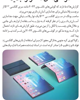
گوشی‌های تاشوئی S23 Ultra ۲۰۲۳ مانند سری گلکسی S23 به جیب‌بلاستیکی برای جیب‌های آسان‌تر باتری بهره می‌برد.

گزارش‌ها ادعا دارند که گوشی‌های تاشوئی S23 Ultra ۲۰۲۳ مانند سری گلکسی S23 به جیب‌بلاستیکی برای جیب‌های آسان‌تر باتری بهره می‌برد. سامسونگ در سری گلکسی S23 یک نوار بلاستیکی جهت جداسازی آسان‌تر باتری را در نظر گرفته که نیز به استفاده از ابزارهای جانبی و حمل‌و‌بار جیب‌ها با الکل را از بین می‌برد. طبق گزارش‌های تازه، احتمال دارد که رویه مذکور در گوشی‌های تاشوئی S23 Ultra نیز شرکت‌کننده باشد. یک منبع نزدیک به سامسونگ می‌گوید که باتری‌های گلکسی Z Fold 4 و Z Flip 4 را صادر کرده است. در اسناد فیلد شده همراه با اندازه یک‌پیکه‌های