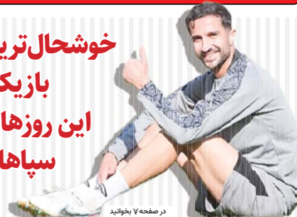
در صفحه ۷ بخوانید