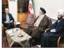
اصل مدارا با مردم فراموش نشود

وی با تأکید بر دشواری کار ترمیمات و سختی دنیایی و اخروی آن گفت: کار ترمیمات بیشتر کار قضاوت است، بنابراین این بسیار بد است که آستان برای دیگران به چشم‌سورد، باید وقت کنیم که آیا جای آن است که گذشت کنیم یا جای آن است که تنبیه کرده و تنبیه را چه میزان انجام دهیم. وی گفت: باید در مسئله قاچاق به این موضوع وقت کنیم که در کشور ما فروش جنس خارجی ممنوع شده و تا حکومت قاچاق جنس خارجی را ممنوع نکند از معازره خرده فرود نمی‌توان به عنوان کالای قاچاق آن را جمع نمود.