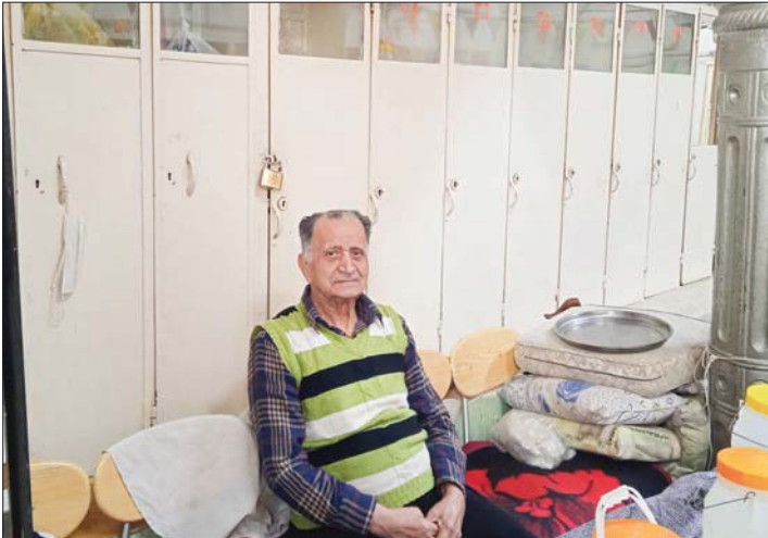
دریاقدری پور جای وسطا کوچه پس کوچه‌های منتهی میدان نقش جهان، جاج‌بان و حمامش را همه می‌نشانند: آخرین بازمانده از حمامی‌های عمومی شهر که در منتهی‌الیه کوچه کرمی پشته به پشت دیوارهای ساهه و با نماهای فرسوده و آجری هنوز نفس می‌کشد: آنجا که هنوز تکنولوژی میراث کهنش را به سرتراخ نبرده و با اینکه خیلی از دل‌های این حمام بی‌حیات کرده اند و با آن شهر رفته اند اما هنوز هم در همسرسش حمام را می‌گرداند. گرمایه ای که خیلی وقت است مثل گذشته بر روی دیوارند و متروک و ساکت و سرد شده اما قصه پیرمرد و حمامش هنوز قلمی در یادها مانده است.

های رنگ، هنوز تراشه‌های هنری که بر دل سنگ حک شده بیستاد. نگاه می‌برد به پیش‌سخت و گنبدی شکل حمام دوخته می‌شود و ادامه می‌دهد: تسلسل حمامی‌ها، با تمام می‌شود، چچه‌ها مثل رانامه نمی‌دهند، چیزی نمانده بود، می‌خواهند ادامه دهند. مخلصان با خرماچان یکی نیست، روزگار این مثل پیوسته شده، مرده‌ها دیگر مشرتی ثابت ندارند، می‌فته‌ای آید یا زنده‌تر بیشتر به اینجا سر نمی‌زنند. این مثل پیرمرد و پسر پندرم به ما رسیده تا حالا مانده‌ایم.