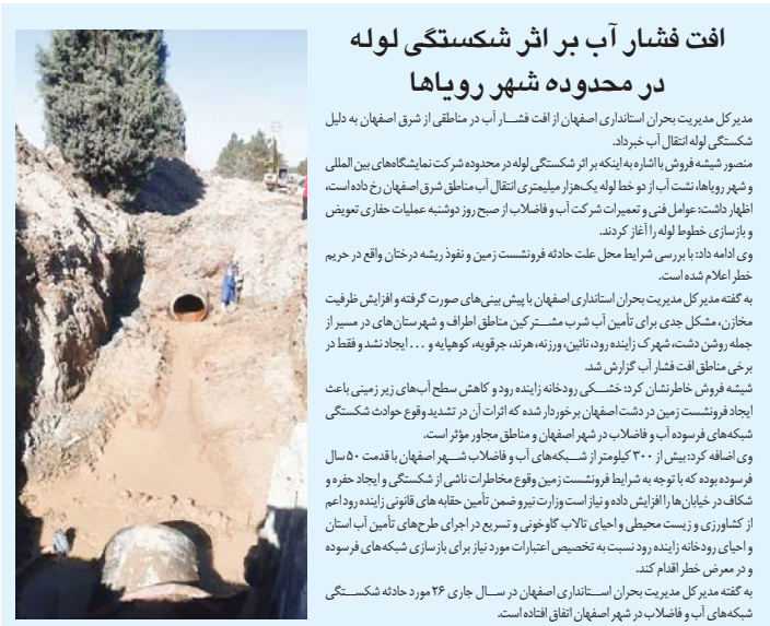
افت قشمار آب بر اثر خشکسالی لوله در محدوده شهر رویاها