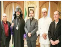
دیدار پیشوایان ادیان توحیدی با استاندار اصفهان