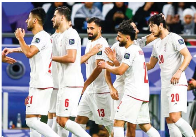
تیم ملی ایران آماده است تا با شکست ستگین امارات، روز بد هنگ‌کنگ را جبران کند.