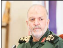
کنگره سرداران و ۲۴ هزار شهید استان برگزار می‌شود

فرمانده سپاه حضرت صاحب‌الزمان (عج) گفت: امروز شرایط را به گونه‌ای رقم زدیم که در اوج بالندگی هستیم و از دشمنان هیچ گونه ترس نداریم و با اقتدار هر کجا که کشور مورد ضربه قرار بگیرد یا آن تهدید با قدرت برخورد می‌کنیم. سرادمجتبی فاذا در رابطه با کارهای عام‌المنفعه، گفت: اگرچه در کمک به دولت و سازمان بهزیستی ما مراکز ترک اعتیاد را ایجاد کردیم و تلاش داریم با کار و تلاش این ترک اعتیاد در اردوگاه‌ها صورت بگیرد؛ کنگره‌های سالانه را به منظور ترویج فرهنگ ایثار و شهادت برگزار می‌کنیم و ما شادان... سال آینده کنگره سرداران و