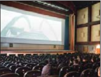
چرا فیلم‌های مطرح جشنواره فجر به اصفهان نیامدند؟