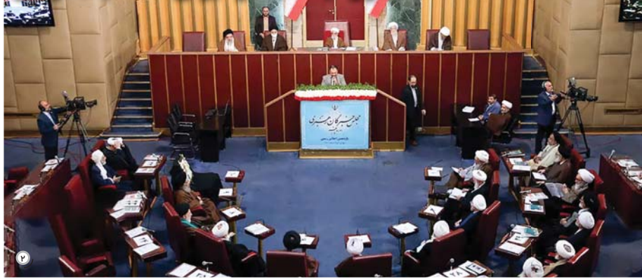
در صفحه ۷ بخوانید