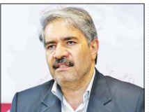
۴ مغایرت قانونی و فنی در برابر توسعه پالایشگاه اصفهان

سالم تصریح کرد: لازم است مسؤولان استان حتی و حقوق شهروندان را پیگیری کنند زیرا مدیریت شهری بیش از ۹ هزار میلیارد ریال در مقاله های مانند محیط زیست و خدمات شهری هزینه کرده اما در این بودجه خیلی کمتر از چهار هزار میلیارد ریال پرداخت شده است.