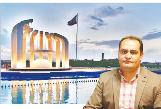
نامه اعتراضی شورای شهر نطنز خطاب به شهردار این شهر

به صورت غیر قانونی صدها میلیارد تومان جرایم معوق عوارض آلاینده‌ها به پالایشگاه اصفهان بخشیده شد