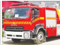
افزایش ایستگاه‌های آتش‌نشانی کاشان

شهری، بلندتر می‌سازد و بافت تاریخی، کاشان نیازمند افزایش ایستگاه عملیاتی آتش‌نشانی بوده که با حمایت و همکاری شورای شهر، شهردار و مدیران شهری در تصویب، اختصاص بودجه و زمین مناسب این نیاز آتش‌نشانی شهری در دو ماهه اخیر با شروع به ساخت ایستگاه‌های شماره ۷ واقع در خیابان غزنوی و شماره ۸ در میدان قاضی‌اشرف. شهردار کاشان انجام کرده است.