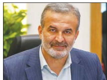
از زمانبندی پروژه های عمرانی عقب هستیم