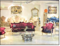
برگزاری جشنواره بزرگ میل رهان تا ۵ اسفندماه