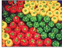
۷۰ هزار تن فنل دلمه‌ای از اصفهان به روسیه صادر شد

اصفهان خاطرنشان کرد: این میزان صادرات از سطح ۵۰۰ هکتار از گلخانه‌های استان صورت گرفته است که پس از سیستان و دیگر اقدامات مورد نیاز به روسیه صادر شد. ریس بیان کرد: با اشاره به تولید سالانه بالغ بر ۳۳ هزار تن انواع محصولات گلخانه‌ای در استان اصفهان، اضافه کرد: حدود ۱۰۰ هزار تن از آن به کشورهای نظیر روسیه، امارات، عمان و عراق صادر می‌شود. تاکنون حدود ۲ هزار و ۵۰۰ هکتار گلخانه در استان اصفهان ایجاد شده است که شهرستان‌های تیران و کرون، فلاورجان، خمینی شهر، هادقان، مبارک، کهشهر، شاهین شهر و میمه و اصفهان بیشترین سهم را دارند.