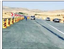
نقاط حادثه خیز اصفهان در حال ایمن سازی است

و جلوگیری از خسارات جانی و مالی، بهسازی و ایمن سازی نقاط حادثه خیز در اولویت کاری قرار دارد. وی با بیان اینکه یکی از اولویت های این اداره کل در سطح استان، رفع نقاط حادثه خیز و تبدیل و ارتقای محورهای موجود است، گفت: نقاط حادثه خیز بر اساس اطلاعات ارائه شده توسط پلیس راه و اداره کل راهداری و حمل و نقل جاده ای مشخص می شود و اولویت بندی در دستور کار اداره کل راه و شهرسازی استان قرار می گیرد. وی افزود: در حال حاضر ۱۱۰ کیلومتر از ۱۱۰۰ کیلومتر طول جاده های استان در دست اقدام است. عملیات ایمن سازی جاده ها با سرعت و کیفیت مناسب است. وی افزود: به منظور رفاه حال کاربران جاده های