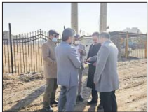
احداث مدرسه سوارکاری با مشارکت بخش خصوصی

استان، کیفیت ایمنی فیزیکی راه، مشکلات و نواقص آن را شناسایی و با اولویت بندی این نقاط در حال اجرای پروژه های ایمن سازی با سرعت و کیفیت مناسب است. وی افزود: به منظور رفاه حال کاربران جاده های