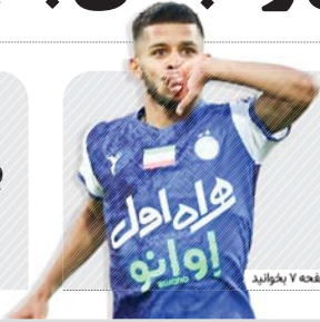
در صفحه ۷ بخوانید