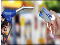
۶۵ درصد اصفهانی‌ها کارت سوخت شخصی دارند