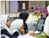
کمبود شدید نیروی پرستاری در مراکز درمانی

رئیس کل سازمان نظام پرستاری از وجود حدود ۲۰ تا ۳۰ هزار پرستار بیکار در کشور خبر داد. محمد میرزایی گفت: شیوع بیماری‌های نوپدید و بازپدید و مرمز، افزایش جمعیت مسلمانان و گسترش تخت‌های بیمارستانی باعث شده که نیاز بسیار زیادی به نیروهای پرستاری داشته باشیم. اما، مجوزهای استخدامی صادر نمی‌شود. وی افزود: حدود ۲۰ تا ۳۰ هزار پرستار بیکار در کشور داریم و این در حالی است که کمبود بیش از ۱۰۰ هزار نفر پرستار مواجه هستیم. میرزایی ادامه داد: در ایام کرونا پرستاران چون به