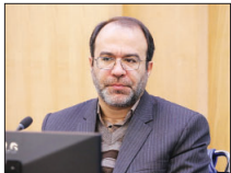
گلوگاه‌های توسعه صنعت اصفهان جکاست؟

جدید را بدون مهاجرت نمی‌توان تأمین کرد. طیفیانی اضافه کرد: با افزایش مهاجرت نیروی کار به استان، علاوه بر کمبود نیروی صنعت باید آب مهاجران را نیز تأمین کرد. در صورتی که پروژه انتقال آب به استان آبی است، این صنعت است، بنابراین مسائل استان اصفهان پیچیده‌تر از مسائل استان دیگر است. وقتی نیروی کار در استان وجود ندارد، به چه علت قرار است به تعداد شهرک‌های صنعتی استان اضافه شود؟ تصمیم برای افزایش تعداد شهرک‌های صنعتی در حالی است که در حال حاضر واحدهای صنعتی به علت کمبود نیروی کار به دنبال به کارگیری اتباع خارجه هستند.