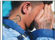
۶۷ زورگیر در اصفهان دستگیر شدند

جدید را بدون مهاجرت نمی‌توان تأمین کرد. طیفیانی اضافه کرد: با افزایش مهاجرت نیروی کار به استان، علاوه بر کمبود نیروی صنعت باید آب مهاجران را نیز تأمین کرد. در صورتی که پروژه انتقال آب به استان آبی است، این صنعت است، بنابراین مسائل استان اصفهان پیچیده‌تر از مسائل استان دیگر است. وقتی نیروی کار در استان وجود ندارد، به چه علت قرار است به تعداد شهرک‌های صنعتی استان اضافه شود؟ تصمیم برای افزایش تعداد شهرک‌های صنعتی در حالی است که در حال حاضر واحدهای صنعتی به علت کمبود نیروی کار به دنبال به کارگیری اتباع خارجه هستند.