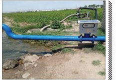
جلوگیری از برداشت میلیون مترمکعب آب زیر زمینی