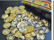
کام شیرین سکه‌بازان تلخ می‌شود؟