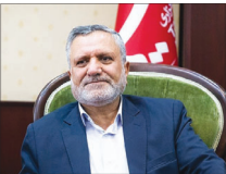
کارگران بر سر حقوق با کار فرما چانه‌زنی کنند!