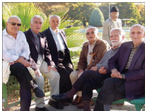
آغاز ثبت‌نام و ۲۰ میلیونی بازنشستگان