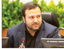
مادی های اصفهان سهمیه آب گرفتند

مدیر کل حج و زیارت اصفهان گفت: یکی از چالش‌های این اداره کل، دلالی در فروش فیش حج است که مردم باید در این زمینه خیلی مراقب باشند.