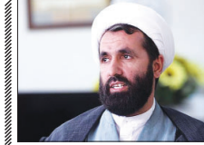
هشدار به اصفهانی‌ها درباره دلالی خرید و فروش فیش حج

در غیر ایستادنمان مانند کودک سرراهی به‌خورد می‌شد، در حالی که آنهاها فلورین محقق دریافت آب بودند.