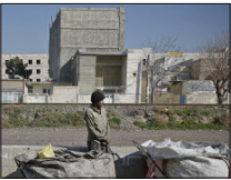
شناسایی ۳۳۰ کارگاه غیرمجاز بازیافت در اصفهان