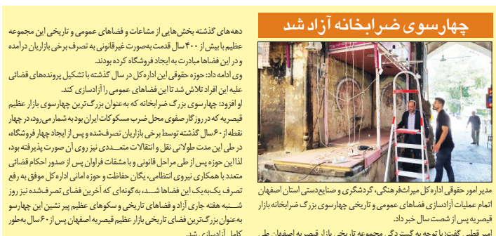
چهارسوی برابرخانه آزاد شد

شهردار خونسار با بیان اینکه پروژه جدول‌گذاری معابر سطح شهر در دست اجراء است، اظهار کرد سه سال بود که مبالغه‌های استگاه آتش‌نشانی نیمه‌تمام مانده بود و سال گذشته با برداشت دیون پیمانکار عملیات سفت‌کاری با اعتباری حدود ۲۵ میلیارد تومان اجراء شد.