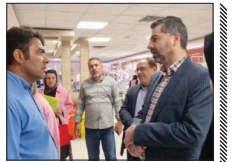
حمایت از خانواده چهارقلوهای نجف آبادی