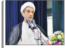
کاهش جمعیت کبیری ابرچالش قوه قضاییه است