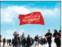
میزبانی مدراس استان از زائران اربعین

استاد اصفهان گفت: در هفته دولت اسما و در اسر استان بالغ ۴۰۰ پروژه عمرانی با سرمایه گذاری بیش از دو هزار و ۵۰۰ میلیارد تومان افتتاح خواهد شد. سردار مرتضوی شگاه شهنه در حاشیه پنجمین جلسه شورای اداری استان اصفهان با جمع خبرنگاران اظهار داشت: موضوعات متعدد و متنوعی در دستور جلسه قرار داشت و در بخش هایی از این نشست به صورت ویژه به موضوع انتخابات و برنامه های استان در هفته دولت پرداخته شد. استاد اصفهان در خصوص برنامه های استان در هفته دولت گفت: زمینه های افتتاح پروژه های متعدد و متنوعی در استان فراهم شده است.