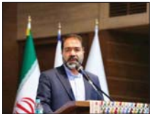
۴۰۰ پروژه عمرانی در اصفهان افتتاح می شود

استاد اصفهان گفت: در هفته دولت اسما و در اسر استان بالغ ۴۰۰ پروژه عمرانی با سرمایه گذاری بیش از دو هزار و ۵۰۰ میلیارد تومان افتتاح خواهد شد. سردار مرتضوی شگاه شهنه در حاشیه پنجمین جلسه شورای اداری استان اصفهان با جمع خبرنگاران اظهار داشت: موضوعات متعدد و متنوعی در دستور جلسه قرار داشت و در بخش هایی از این نشست به صورت ویژه به موضوع انتخابات و برنامه های استان در هفته دولت پرداخته شد. استاد اصفهان در خصوص برنامه های استان در هفته دولت گفت: زمینه های افتتاح پروژه های متعدد و متنوعی در استان فراهم شده است.