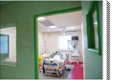
زیر سویه جدید کرونا به ایران نرسیده است