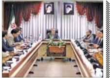
شناسایی ۱۱۰ هزار خانه لوکس برای دریافت مالیات