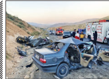
علت ۹۰ درصد تصادف‌های رانندگی در اصفهان