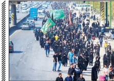
حضور دانش‌آموزان اصفهانی در «پوشش خبرنگار ارجمین»