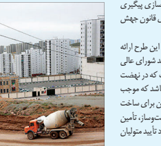
حالا بنا بر آنچه کارشناسان می‌گویند راه‌حل قطعی این معضل در

اصفهان تنها در راستای ساماندهی و تسهیل در ساخت‌وساز امکان‌پذیر است و یکی از این راهکارها اختصاص و الحاق زمین‌هاست که برای ساخت مسکن موردنیاز است. موضوعی که اکنون در اصفهان به‌سرعت در حال انجام است. در این راستا همین یکی دو روز پیش مدیرکل راه و شهرسازی استان اصفهان از موافقت با آن در ۱۴ شهرستان اصفهان آذوده و اعلام کرده که در این رابطه موافقت کمیته نیز اخذ شده است. تعداد ۲۷ شهرسازی قرارآن اشاره کرده در راستای اجرای طرح نهضت ملی مسکن، ۳۶۶/۵ هکتار زمین در ۱۴ شهرستان اصفهان در دست الحاق است و همچنین با تلاش و پیگیری‌های به‌معم‌آمده ۹۳۳/۷ هکتار زمین هم در ۳۲ شهرستان اصفهان الحاق شده است.