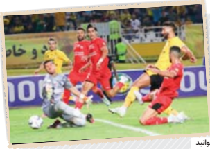
در صفحه ۷ بخوانید

حیات دریا، دوباره اسیر تور «ترال» می شود؟