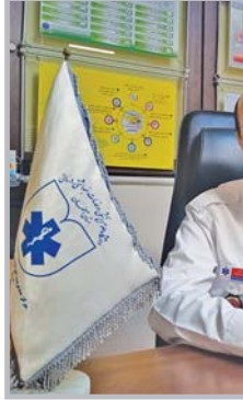
امیرحسین حسینی، رئیس اورژانس پیش بیمارستانی استان اصفهان

یک طرفه است، چرا که هر چه گفته می شود باید ما قبول کنیم و هیچ چاره ای جز این نداریم اگر کسی ادعایی دارد که شرح حال اورژانسی دادم و آمبولانس فرستاده نشده بررسی های لازم انجام می شود که تقریباً صد درصد شکایات خیلی خیلی کم است؛ اما در شکایات این چنینی اگر حق با مداخلان ما بوده و کارشناس ما اشتباه کرده تاخیر لازم انجام می شود.