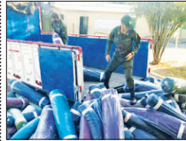
کشف انبار ۱۰۰ میلیارد ریالی پارچه در اصفهان

جانشین فرمانده انتظامی استان اصفهان از کشف پارچه‌های اشکار شده در یک انبار به ارزش ۱۰۰ میلیارد ریال در عملیات مأموران پلیس امنیت اقتصادی خبر داد. سردار محمد رضا هاشمی فر در جمع خیرکاران اظهار کرد: مأموران پلیس امنیت اقتصادی فرماندهی انتظامی استان اصفهان در پی کشف کسب خوری مبنی بر احکام مقدار زیادی پارچه در یکی از انبارهای حاشیه شهر اصفهان موقوف به دو دقت مورد بررسی قرار دادند. موضوع از فرمانده انتظامی استان اصفهان افروید: مأموران پس از تحقیقات تخصصی صورت گرفته و کسب اطمینان از درستی موضوع در هماهنگی