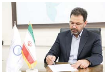
مدیرعامل آبنمای استان اصفهان از بهره‌برداری فاز نخست پروژه تقویت آبرسانی به هسته مرکزی شهر اصفهان تا یک ماه آینده خبر داد.

مدیرعامل آبنمای استان اصفهان افزود: وجود تاسیسات زیربنایی متعدد از قبیل خط پر فشار گاز شهری، شبکه مخازرات، کلکتور جمع آوری فاضلاب و شبکه توزیع آب آشامیدنی و آب فضای سبز، از جمله مشکلات حین اجرای این پروژه بوده است. مدیرعامل آبنمای استان اصفهان به برخی دیگر از چالش‌های حین اجرای این پروژه پرداخت و خاطر نشان کرد: اخذ مجوزهای لازم از مراجع مربوطه، بار تهاکی موجود، عبور از عرض خیابان‌ها با وجود تاسیسات متعدد زیربنایی از چالش‌های حین کار بوده است. این درحالیست که برای ادامه اجرای این پروژه به سختی‌هایی از قبیل عملیات لوله گذاری در عرض خیابان آتشگاه، عبور خط انتقال اجرایی از عرض بزرگراه شهید خرازی، اجرای عملیات در ایستگاه مترو و اتوبان شهید خرازی مواجه خواهیم شد. وی با اشاره به اجرای فاز دوم این پروژه افزود: این عملیات حدود ۱۴۵۰ متر است که با استفاده از لوله چند دانگین در دستور کار قرار گرفت که عملیات لوله گذاری در بخش ایستگاه مترو مقابل بیمارستان کاشانی در مرداد ماه سال جاری به طول ۷۰۰ متر اجرا شد و از چهارم شهریور ماه سال جاری عملیات اجرایی ۳۵۰ متر لوله گذاری و پرسیاری شبکه آب واقع در خیابان پستان نیز شروع شده که انتظار می‌رود تا پایان ماه جاری عملیات لوله گذاری پرسیاری ترانسه و ساخت حوضچه شیرالات آن به پایان رسد. مدیرعامل آبنمای استان اصفهان در خصوص اعتبار هزینه شده در این پروژه گفت: تا کنون برای اجرای این پروژه ۳۵۴ میلیارد ریال هزینه شده که از بخش بودجه جاری عمرانی تأمین اعتبار شده است و برآورد شده برای اتمام پروژه به بیش از ۵۰۰ میلیارد ریال دیگر نیاز است.