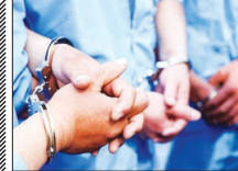
پایان کار «سارقان آخر هفته» در اصفهان

دست آورده و با شناسایی هویت اصلی آنان در یافتند که این افراد جزو مجرمان غیربومی و در حرکت هستند که آخر هفته‌ها در استان اصفهان دست به سرقت می‌زنند. رئیس پلیس آگاهی استان اصفهان تصریح کرد تحقیقات در این خصوص ادامه داشت تا اینکه با صد هوشمندانه کارآگاهان سارقان شناسایی و در عملیات ضربتی دستگیر شدند. وی افزود: سارقان در تحقیقات تکمیلی پلیس به ۱۰ قهره سرقت از منازل اعتراف کردند که ارزش این اموال برابر ارزشی کارشناسان مربوطه بالغ بر ۳۰ میلیارد ریال برآورد شده است.