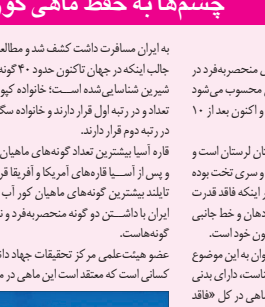
Photograph of a cave interior with water flowing from a rock, showing the cave's structure and the location of the fish.

به ایران مسافرت داشت گفت شد و مطالعاتی بر روی آن انجام گرفت. جالب اینکه در جهان تاکنون حدود ۴۰ گونه ماهی بدون چشم در آب های شیرین شناسایی شده است.