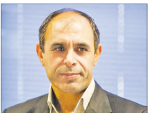
الینوو ۲۰ هزار کیلومتر با ایران فاصله دارد