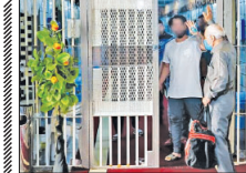
۱۰۱ زندانی جرایم غیر عمد در اصفهان آزاد شدند