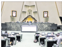
بزرگ ترین سرمایه گذاری کشور در انرژی هسته ای

مجلس ۱۰ اردصد بودجه سالانه کشور در برنامه هفتم توسعه راه انرژی هسته ای اختصاص داده است که البته باید در صحن به رای نمایندگان گذاشته شود.