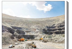
۱۱۷ محدوده معدنی جدید شناسایی شد