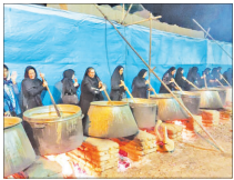
بزرگ‌ترین آتش نذری کشور هنوز ثبت ملی نشده است

وی با بیان اینکه برف زنجار از نیروهای یگان منابع طبیعی استان روز جمعه در گشت و پایش ناآزرای شرق استان متوجه حضور قایماچی چوب شدند. افزود: نیروهای ما برای توقیف متخلفان اقدام می‌کنند که قایماچی‌ها، حین فرار یک مأمور یگان حفاظت را با خودرو زیر گرفتند. فرمانده یگان حفاظت منابع طبیعی و آبخوان‌های استان اصفهان با بیان اینکه قایماچی‌ها سه نفر بودند که یک نفر از آنان دستگیر شده است، اضافه کرد: قایماچیان قصد داشتند محموله چوب‌های ناآز را با یک خودروی مسدود جابه‌جا کنند که خودروی آنان نیز توقیف شده است.