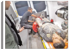
قایماچی چوب، جنگلگان اصفهانی را زیر گرفت

وی با بیان اینکه برف زنجار از نیروهای یگان منابع طبیعی استان روز جمعه در گشت و پایش ناآزرای شرق استان متوجه حضور قایماچی چوب شدند. افزود: نیروهای ما برای توقیف متخلفان اقدام می‌کنند که قایماچی‌ها، حین فرار یک مأمور یگان حفاظت را با خودرو زیر گرفتند. فرمانده یگان حفاظت منابع طبیعی و آبخوان‌های استان اصفهان با بیان اینکه قایماچی‌ها سه نفر بودند که یک نفر از آنان دستگیر شده است، اضافه کرد: قایماچیان قصد داشتند محموله چوب‌های ناآز را با یک خودروی مسدود جابه‌جا کنند که خودروی آنان نیز توقیف شده است.