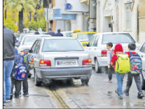
۱۰۰ مدرسه عامل اختلال ترافیکی هستند

اگرچه بسیاری از این مدارس در مناطق یک، سه، پنج و شش شهرداری قرار گرفته‌اند اما تعداد قابل توجهی نیز در سایر مناطق به ویژه مناطق هشت و ۱۰ قرار دارد. حقیقت‌ناسا با بیان اینکه یکی دیگر از اقدامات مهم در آستانه بازگشایی مدارس، اطلاع‌رسانی زمان رسیدن اتوبوس به ایستگاه‌ها به صورت برخط از طریق نرم‌افزار سرویس‌رسانان است، گفت: این اطلاعات پیش از این فقط در نرم‌افزار اصردو در دسترس بود، از این و شهروندان می‌توانند علاوه بر سرویس‌رسانی خطوط اتوبوس در این نرم‌افزار، از زمان رسیدن اتوبوس نیز در هر ایستگاه با استفاده از نرم‌افزار نشان مطلع شوند.