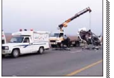
تصادفات جاده‌های استان شهرویان رکورد زد