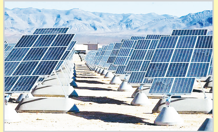
دریا قدرتی دور

انرژی روز افزون هوا باعث می شود که اصفهان به تها در تابستان که در زمستان هم دچار مشکلات و مضطربت زیادی شود. نتایج مطالعات طرح جامع انرژی نشان می دهد که با توجه به محدودیت تأمین سوخت نیروگاهی متناطب با هزینه تولید و تنش‌های آبی نیروگاه‌های برقی آبی و گاش ۳۰ درصدی اوراد بر پشت سد‌ها، لزوم توسعه هر چه بیشتر نیروگاه‌های تجدیدپذیر به ویژه خورشیدی در اصفهان ضرورتی بیش از پیش پیدا می کند. در حال حاضر به گفته مدیران صنعت برق اصفهان بیش از ۹۰ درصد برق استان از طریق نیروگاه‌های فسیلی تأمین می شود و این در حالی است که این عدد باید معکوس شود و به بخش انرژی‌های تجدیدپذیر اما با وجود اینکه خرید تضمینی بر تولیدی نیروگاه‌های تجدیدپذیر از برنامه چهارم توسعه آغاز شده است منابع مالی از محل عوارض برق در قانون بودجه سالانه کشور دارای پشتوانه قانونی ماده ۵ قانون حمایت از صنعت برق