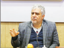
۳۰۳۸ پایگاه جشن عاطفه‌ها در اصفهان برپا می‌شود