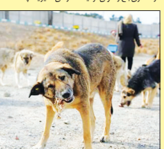
رئیس اداره ماهنگی و نظارت خدمات شهری شهرداری اصفهان گفت: با حضور تعدادی دامپزشک به‌صورت دولتی و افتخاری در پناهگاه حیوانات بلاصاحب اصفهان عظیم‌سازی سگ‌های بلاصاحب به‌نوعی رکوردشکنی در کشور محسوب می‌شود.