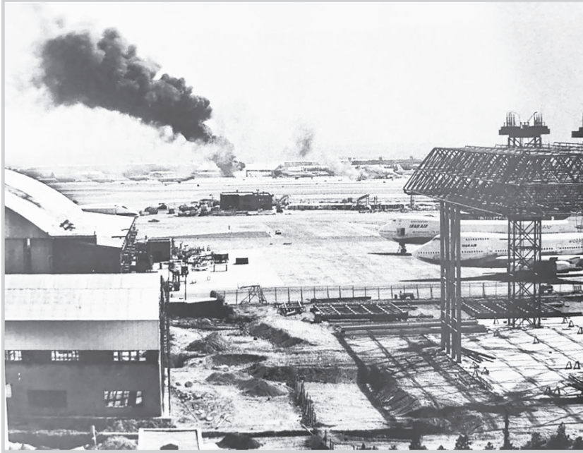
نخستین عکس منتشر شده از حمله عراقی ها به تهران در ۳۱ شهریور ۱۳۵۹ توسط عباس فتحي، عکاس روزنامه کیهان گرفته شده است. در این عکس نمایي از بمباران فرودگاه مهرآباد تهران توسط هواپیمای عراقی به تصویر کشیده شده است...