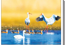
«رؤیا» به استقبال «مید» می رود