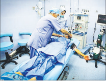
چهره اصیل ایرانی در حال تغییر است

در همین روزها قرار است به‌رسم و روال هر ساله یک سفر طولانی به مازندران آغاز شود؛ سفر «مید» از غرب سیبری به «بوچاک» در فریدون‌کنار، تک‌درنای گله غریب سیبری که به‌احتیاج زیاد سفرش به مازندران را گله غریب، در ماه‌های سیبری از ۱۶ سال پیش تا کنون، قبیله‌ای یک نفره است. درنای که پس از مرگ یا به عبارتی بهتر ناپدید شدن جفت خود تنها شد تا تازگی دنیای درنای تنها به‌بخشی از حافظه حیوانات سیست مازندران ستیاق شود. در این ۱۶ سال گام‌هایی برای رها نشدن «مید» از تنهایی برداشته شد که هیچ کدام