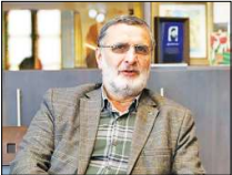
فعالیت دسته‌های عزاداری به صورت سنتی پایدار بماند

اینکه منبر و سخنرانی یکی از پایه‌های اساسی حیات‌های مذهبی باید باشد، تصریح کرد: در متولیان حیات‌های مذهبی و جلسات دعا و خطابه را از برنامه‌های هنگی و روزانه خود حذف نکنند و همواره به دنبال انتقال مفاهیم باشند. وی به ضرورت تقویت و حمایت از فعالیت‌های حیات‌های مذهبی اشاره کرد و اذعان داشت: تقویت شدن این تشکلهای و جریان‌های فرهنگی راه‌سفر قرار می‌دهد تا به اهدافش برسد، مردم و نهادهای متولی نیز باید به ترویج و گسترش فعالیت‌های فرهنگی و هنری، شعار بیشتر بپردازند. چنانتری تصریح کرد: هفته گران، سران آشوب و دشمنان در تاخت و تازهای خود ماسم‌های عمرانی را هدف قرار داده‌اند.