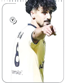
مدیرعامل فولاد مبارکه تاکید کرد: