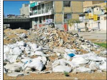
تخلیه ناخالصی‌های ساختمانی در اصفهان، هوشمند می‌شود