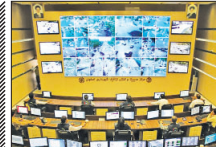
رصد گر ه های ت ر ا ف ی ک ی شهر اصفهان

وی افزود: اکنون ایران به توانمندی‌های خوبی رسیده که می‌توان برای هر کدام از آنها رویدادهای بزرگی را اجرا کرد. یکی از این رویدادهای بزرگ، جایزه علم و فناوری مصطفی