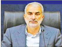
میزبانی اصفهان برای رویدادهای علمی ادامه‌دار خواهد بود

استه این اتفاق موجب اجرایی شدن اهداف قرآنی و سیاست‌های نظام می‌شود. وی با بیان اینکه اصفهان پایتخت فرهنگی ایران است، اضافه کرد: جایزه مصطفی یک رویداد فرهنگی است و اصفهان در این زمینه همواره پیشرو بوده است چرا که در این شهر کارهای بدیع و نو به عین اجرا می‌شود. از همین میزبانی اصفهان برای المپیاد فیزیک که سال آینده در همین شهر برگزار می‌شود ادامه در خواهد بود.