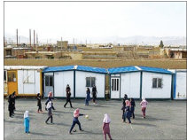
مدارس سنگی و کانکسی اصفهان برچیده می‌شود

کمک خیران، بنیاد و اعتبارات دولتی انجام می‌شود. مدیرکل نوسازی، توسعه و تجهیز مدارس استان اصفهان تصریح کرد: شهرستان سمیرم، فریدون شهر و برخی از روستاهای نشانان دارای مدارس سنگی و کانکسی هستند و روستاهای «خیران» منطقه تکمیل گوه فریدون شهر به دلیل عدم دسترسی مناسب مسیر ناز به همکاری بیشتر از کان‌هایی نظیر سباه و ارتش دارد. وی ادامه داد: نوسازی مدارس برای احداث مدرسه آدامگی دارد اما برای انتقال، حمل و نصب برخی از مصالح ساختمانی پیش ساخته با مشکل حمل مواجه است.