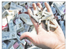
فروش سالانه ۲۰ میلیارد نخ سیگار قاچاق

رئیس انجمن تولیدکنندگان دخانیات گفت: طبق برآوردهای انجام شده سالانه بین ۲۰ تا ۲۰۰ میلیارد نخ سیگار قاچاق وارد کشور می‌شود. بر همین اساس، حدود ۸۰ تا ۸۵ درصد بازار دخانیات در اختیار تولید و قاچاق داخلی و ۱۵ تا ۲۰ درصد در اختیار قاچاق است. با این حساب، میزان محصولات قاچاق و تقلبی در گروه کارایی دخانیات بسیار بالاست. در همین رابطه، اخیراً محمدمندی برادران، معاون صنایع عمومی وزیر صمت گفته است: فروش انواع محصولات دخانی در تمام واحدهای توزیع عمده و خرده‌فروشی می‌بایست تا شامه کالا صورت پذیرد همچنین با اجرای طرح شناسه کالا نباید