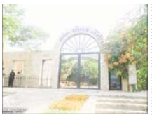
۲ توله شیر در پارک وحش صفا به دنیا آمدند