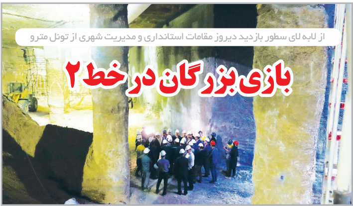
از لایه لای سطور بازدید دیروز مقامات استانداری و مدیریت شهری از تونل مترو

مطابق با آخرین برآوردها، هزینه احداث خط ۲ متروی اصفهان حدود ۱۰۰ میلیارد تومان در یک کیلومتر برآورد شده