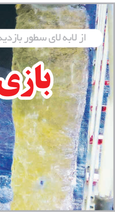
از لایه لای سطور بازدید دیروز مقامات استانداری و مدیریت شهری از تونل مترو

شاه این اثر تاریخی خارج شد. مدیران اداره میراث فرهنگی، گردشگری و صنایع دستی تیران و کرون با بیان اینکه دوومین شهر زیرزمینی این شهرستان نیز با خاک بر شده مطالعه و کاوش‌های باستان‌شناسی هستیم.