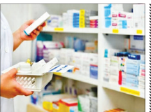
داروی ۴۰ هزار تومانی را ۱۰ میلیون می‌فروشند!