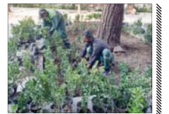
کاشت ۳۰ هزار شمشاد طلایی در چهارباغ عباسی