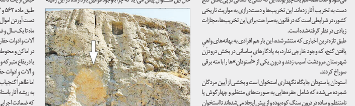
اساتون یاسونان جایگاه نگهداری استخوان است و بخشی از آیین مردگان

مریم مصسنی حقیقتی درناک که گویا تمامی ندارد. مسئله‌ای که دیگر افسانه نیست و چونندگان گنج به خیال کشیده بودند. پلارن بالای جان میراث فرهنگی و تاریخی کشور می‌شوند و به خیال به دست آوردن گنجی به ریشه آثار تاریخی می‌زنند. هم‌نامی که از سالیان دور تاکنون ادامه داشته و به نظر می‌رسد که پایانی هم ندارد. شاهد این مدعا هم اخبار نازحانه‌کننده‌ای است که از گوشه و کنار منتشر می‌شود و به تأخیر آید که کسی با کسبی در پی یافتن گنج دست به تخریب آثار زارندان این تخریب‌ها و دست‌کاری به مواریت تاریخ کشور، در شرایطی است که در قانن، مصراحت برای این تخریب‌ها، مجازات زایدی در نظر گرفته شده است.