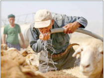
۴۰۰ نقطه عشایری با تانکر بسیار آبرسانی شد

استان آموزش داده شده است. مدیرکل مدیریت بحران استان اصفهان تصریح کرد: حدود چهار هزار خانوار عشایری از آیل قشقایی در شهرستان سمیرم به کشاورزی و تولید میب درختی اشتغال دارند که سالانه حدود ۱۵۰ هزار تن محصول تولید می‌کنند. وی افزود: این عشایر با توجه به اینکه اواخر تابستان و اوایل پاییز مشغول برداشت میب هستند، دیرتر از سایر عشایر و اواخر آبان از استان اصفهان به سمت استان‌های گرم جنوبی فارس، خوزستان، بوشهر و گیلوگیه و بویر احمد کوچ می‌کنند.