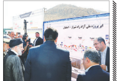
آزادراه شیراز-اصفهان رسماً بهره‌برداری شد

همزمان با سفر رئیس‌جمهوری به استان فارس، آزادراه شیراز به استان اصفهان (ایزدخواست) به طول ۲۱۲ کیلومتر و به‌عنوان طولانی‌ترین آزادراه ایران به بهره‌برداری رسید.