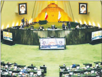
کدام نمایندگان در جلسات رسیدگی به برنامه هفتم غایب بودند

کرده و مسیر شمال به جنوب کشور را تکمیل کند. افزود: بزگره شیراز-اصفهان به نام حضرت شاهچراغ (ع) نامگذاری شود و باید از شیراز به اصفهان و از شیراز به بوشهر تکمیل شود و مورد استفاده مردم قرار گیرد.