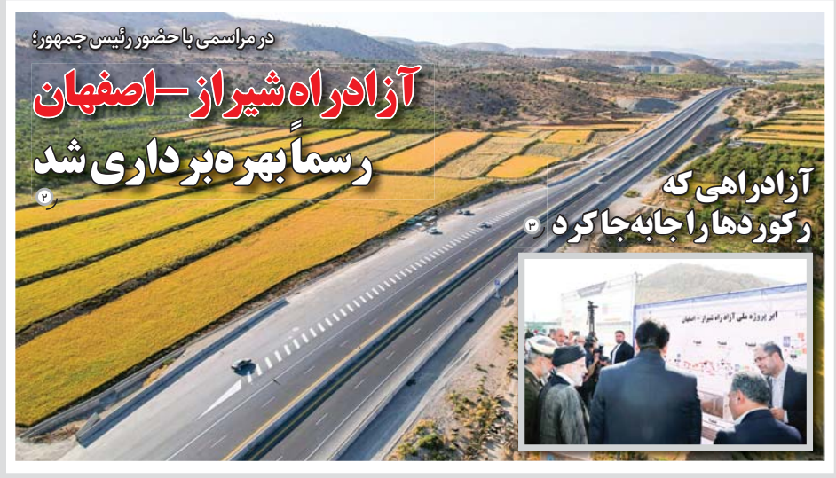
در صفحه ۷ بخوانید

در مراسمی با حضور رئیس جمهور؛ آزادراه شیراز-اصفهان رسماً بهره‌برداری شد