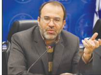
آب زاینده رود مثل چک بی محل است!

می‌تدیری کسی می‌شود آب رودخانه است، بطوری که اسباب تخصیص سال آبی برای کشاورزی، ۵۵۰ میلیون متر مکعب بود که تنها ۲۵۰ میلیون متر مکعب دریافت شده است.