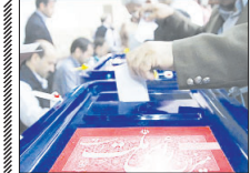
آغاز ثبت‌نام نهایی مقاضیان داوطلب انتخابات ام‌روز