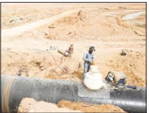
انتقال آب به اصفهان، فرصت نقش آفرینی دانش بنیان ها

مدیر امور باغبانی جهاد کشاورزی اصفهان گفت: علاوه بر ادامه خشکسالی و کاهش کمی و کیفیت آب مورد نیاز، دمای بالای هوا به هنگام بار شدن، پسته در پستان از عوامل اصلی کاهش عملکرد باغات پسته در استان در سال جاری است.