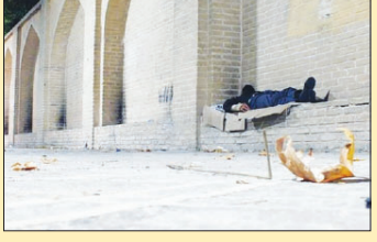
۶۰ کارتن خواب در اصفهان

مدیر کل پیگیری و رفع تخلفات شهری شهرداری اصفهان گفت: طی سه روز گذشته، تعداد ۶۰ کارتن خواب در سطح این کلانشهر شناسایی و به مراکز مشخص شده هدایت و توسط پلیس مبارزه با مواد مخدر ساماندهی و غربالگری شدند. این افراد با توجه به برودت هوا و پیش‌بینی بارش باران در سطح شهر اصفهان، طرح ساماندهی اصفهان در حال اجرا است.