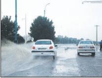
حفر ۱۴۰۰ چاه جذبی در اصفهان

وی افزود: در حال حاضر این مشکلات تا حد زیادی با انجام اقداماتی از جمله هفرینش از یک هزار و ۴۰۰ چاه جذبی رفع شده است.