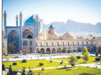
۵۶۲ اقدام مرمتی برای حفظ بناهای تاریخی اصفهان

مدیر کل میراث فرهنگی، گردشگری و صنایع دستی اصفهان گفت: در یکسال گذشته ۵۶۴ اقدام مرمتی و حفاظت یافته، بناها و محوطه‌های تاریخی شامل مطالعه و اجرا در استان انجام شده است.