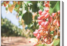
گرمای هوا بار درختان پسته را کم کرد

مدیر امور باغبانی جهاد کشاورزی اصفهان گفت: علاوه بر ادامه خشکسالی و کاهش کمی و کیفیت آب مورد نیاز، دمای بالای هوا به هنگام بار شدن، پسته در پستان از عوامل اصلی کاهش عملکرد باغات پسته در استان در سال جاری است.