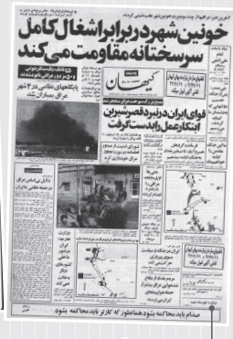
کیهان / ۳ آبان ماه ۱۳۵۹

خرمشهر بعد از ۳۱ روز درگیری شدید، در تاریخ ۲۰ آبان ۱۳۵۹ به اشغال ارتش عراق درآمد. روزنامه‌های کشور در چند روز منتهی به ۴ آبان خبر از مقاومت شدید در آخرین لحظات قبل از سقوط شهر می‌دادند.