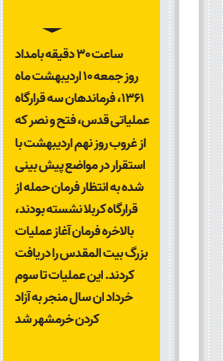
کیهان / ۲ خرداد ماه ۱۳۶۱