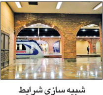
شعبه‌سازی شرایط اضطراری در متروی اصفهان