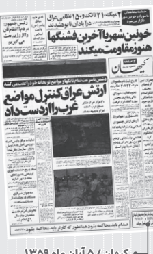
کیهان / ۵ آبان ماه ۱۳۵۹