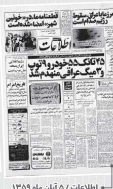
اطلاعات / ۵ آبان ماه ۱۳۵۹