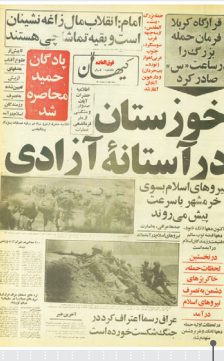
کیهان / ۱۰ اردیبهشت ماه ۱۳۶۱

خسارت سنگین به دشمن چهارمین مرحله عملیات بیت المقدس در روز دوم خرداد ۱۳۶۱ یک پیروزی بزرگ برای نیروهای ایران محسوب می‌شود. استقرار تیپ‌های مختلف چهار قراقره در طرف خرمشهر و تکمیل محاصره این شهر، آزادسازی آن را قریب الوقوع کرده است. تیپ‌های پیروز ایرانی ضمن درگیری با بقایمانده دشمن که همچنان مقاومت می‌کنند، آماده می‌شوند عملیات خود را برای ورود به خرمشهر و پاکسازی آن آغاز کنند. تلاوت این پیروزی وقتی بیشتر می‌شود اسارت رها می‌گردد. «خوبین شهر با آخرین فتیله هانوز مقاومت می‌کند». بعد از ظهر دوشنبه پنجم آبان ماه ۱۳۵۹ که مردم پایتخت این تیر درشت صفحه اول روزنامه «کیهان» را مشاهده می‌کردند، یک چشمشان اشک بود و یک چشمان آه، خرمشهر محبوب ایران، یک روز قبل تر، بعد از ۲۳ روز مقاومت سقوط کرده بود. ۱۸ ماه بعد، جمعه دوم اردیبهشت ماه ۱۳۶۱، همان مردم با شور و امید به تیر اول شماره فوق العاده روزنامه «کیهان» می‌نگریستند و برای آزاد شدن شهر اسیرشان لحظه شماری می‌کردند: خوزستان در آستانه آزادی». بالاخره بعد از ظهر سوم خرداد ماه ۱۳۶۱، یانصد و هفتاد و پنج روز بعد از افسوس بزرگ از دست رفتن پاره تن ایران، تیرهای درشت شماره‌های فوق العاده همه تشریفات کشور در دست مردان و زنان خوشحالی دیده می‌شد که از ساعت ۱۱ همان روز جشن بزرگی را در خیابان‌های شهرهای بزرگ نزدیک به راه انداخته بودند: «خرمشهر آزاد شد»