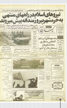
کیهان / ۲ خرداد ماه ۱۳۶۱

که خسارت وارد شده به ارتش عراق بسیار سنگین و تعداد شهدا و خسارت به قوای ایران بسیار اندک می‌گردد. اکبر هاشمی رفسنجانی در خاطرات روز دوم خرداد ۱۳۶۱ به همین موضوع اشاره کرده است: «اول وقت از جبهه اطلاع گرفتم. گزارش‌ها دادند که عملیات را دیسب آغاز و جاده خرمشهر - شلمچه تا تصرف کرده ایم و به طرف بل‌ ام الرصاص پیش می‌رویم. ساعت ۷ به جلسه عالی مجلس رفتم. خبر عملیات پس گرفتن خرمشهر در فضای مجلس پیچیده بود و همه خوشحال بودند. هنگام تنص با جبهه تماس گرفتم. معلوم شد که خرمشهر کاملاً محاصره شده و دشمن در حال تسلیم شدن است... تا شب به طور مرتب خبر از کثرت اسرا می‌رسد و دشمن، هم کشته و زخمی زیادی داشته و هم غنیمت فراوان به جا گذاشته است...» یک سند مرکز مطالعات و تحقیقات جنگ به نقل از رایوی قرارگاه مرکزی کربلا، اولین آماری که از تعداد شهیدان عملیات روز دوم خرداد ثبت شده است را به این شرح اعلام می‌کند: تعداد شهیدان قراقره فتح ۱۶۰ نفر و قراقره نصر ۲۲۸ نفر.