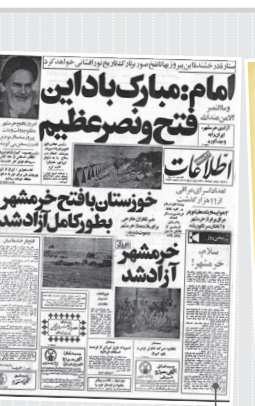
اطلاعات / ۴ خرداد ماه ۱۳۶۱