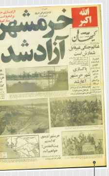
کیهان / ۳ خرداد ماه ۱۳۶۱