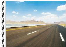
افتتاح آزادراه شیراز-اصفهان، ۲۰ مهر

سال‌های اخیر مجتمع تجاری نیوشا در خیابان استانداری و در حریم بافضاضل میدان نقش جهان موفق به دریافت مجوز ساخت سه طبقه زیرزمین و سه طبقه ساخت شد. در صورتی که ارتفاع بیش از ۹ متر در ارتفاع مجوز صوب حریم میدان نقش جهان یعنی پنج متر است و این به اعتراضی کارشناسان میراث فرهنگی و تکلیت اداره کل میراث فرهنگی گردشگری و صنایع‌دستی استان اصفهان منجر شد و عقبت دیوان عدالت اداری، بی به تعدیل ارتفاع آن داد اما تا این لحظه این رای اجرا نشده است.