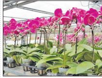
تولید نشای گل ارکید به باکترین هزینه در اصفهان