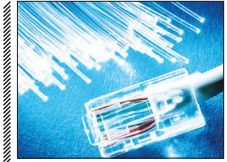
دسترسی منازل و کسب و کارهای اصفهان به فیبر نوری