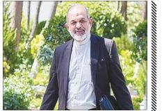
ثبت نام افراد جا ماندگه ممکن نیست

وزیر کشور در خصوص ثبت نام داوطلبان انتخابات دوازدهمین دوره مجلس شورای اسلامی و احتمال بررسی شرایط افرادی که در مرحله پیش ثبت نامها جا ماندگه و نتوانستند در انتخابات ثبت نام کنند، گفت: در خصوص افرادی که در مرحله پیش ثبت نامها جا ماندگه و نتوانستند در آن مرحله حضور داشته باشند ولی می‌خواهند وارد مرحله ثبت نام اصلی شوند، باید بگویم که بر اساس قانون نمی‌توانیم کاری را انجام دهیم. احمد وجدی گفت: افزود: ما در وزارت کشور نمی‌توانیم برای جاماندگان از پیش ثبت نامها کاری انجام دهیم مگر آنکه مصوبه‌ای از مجلس شورای اسلامی داشته