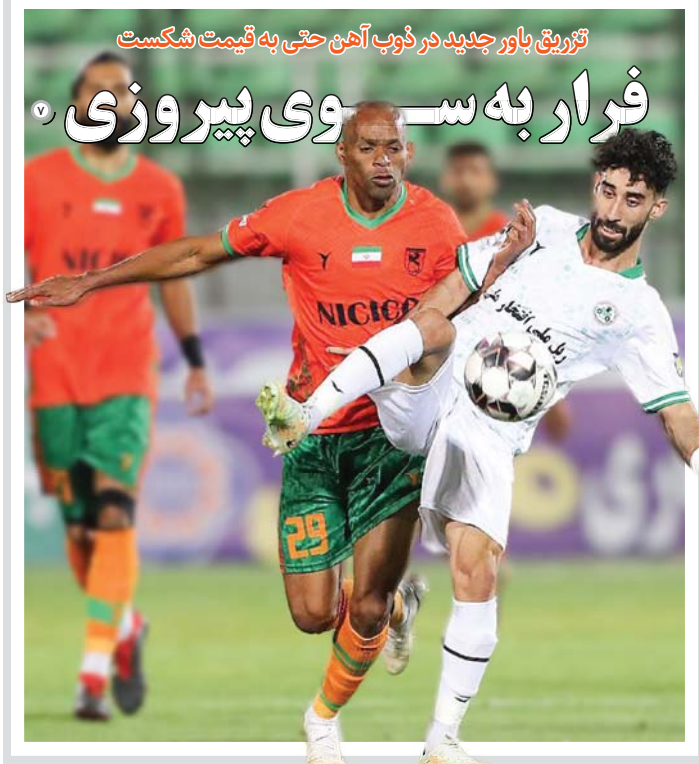
تزییق باور جدید در ذوب آهن حتی به قیمت شکست