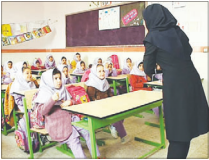
معلم های جدید از امروز در کلاس ها

وزیر کشور در خصوص ثبت نام داوطلبان انتخابات دوازدهمین دوره مجلس شورای اسلامی و احتمال بررسی شرایط افرادی که در مرحله پیش ثبت نامها جا ماندگه و نتوانستند در انتخابات ثبت نام کنند، گفت: در خصوص افرادی که در مرحله پیش ثبت نامها جا ماندگه و نتوانستند در آن مرحله حضور داشته باشند ولی می‌خواهند وارد مرحله ثبت نام اصلی شوند، باید بگویم که بر اساس قانون نمی‌توانیم کاری را انجام دهیم. احمد وجدی گفت: افزود: ما در وزارت کشور نمی‌توانیم برای جاماندگان از پیش ثبت نامها کاری انجام دهیم مگر آنکه مصوبه‌ای از مجلس شورای اسلامی داشته