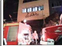
بازگشایی ساختمان آتش گرفته دانشگاه صنعتی

چندی پیش خمیان شهید بهشتی شاهد تخریب بخشی از این مسیر و نصب پرچم با عنوان احداث خطوط پی آر تی شد که این عمل واکنش‌های زیادی را از سوی کسبه خمیان یاد شده به همراه داشت. این در حالی است که مدیر منطقه یک شهرداری اصفهان همز با عملیات اجرایی در یکی از شلوغ‌ترین و پُرترددترین خطوط اتوبوسرانی اصفهان حداقل میدان جمهوری تا پل فلزی معاونت حمل و نقل و ترافیک شهرداری اصفهان می گوید: ترافیک ایجاد شده در خمیان شهید بهشتی اصفهان به دلیل اجرای