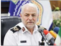
عمده خودروهای وارداتی از چین می‌آیند

مدیرکل راه‌آهن شرق افزود: این قطار باری به وزن ۳۳۸۰ تن از ایستگاه خواف در راه‌آهن شرق به بندر امام خمینی (ره) برای سیر مسافت ۲۰۲ کیلومتر اعزام شد. وی تصریح کرد: برای اولین بار در تاریخ راه‌آهن شرق، برای یک قطار باری در این مسافت طولانی و تن کیلومتر مبدأ-مقصدی بالا، بارنامه صادر شده که نشان از تلاش و کوشش کارکنان راه‌آهن شرق و تعامل دارد.