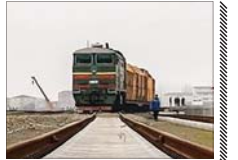
اعزام قطار باری با طولانی‌ترین بُعد مسافت برای اولین بار

مدیرکل راه‌آهن شرق از اعزام قطار باری برای اولین بار، با طولانی‌ترین بُعد مسافت و بیشترین تن کیلومتر مقدس بندر امام خمینی (ره) در راه‌آهن جنوب انجام شد. وی اظهار کرد: با پیگیری‌های انجام‌شده و در راستای تحقق جایگاه واقعی حمل‌ونقل ریلی به عنوان یکی از پیشران اصلی توسعه پایدار اقتصادی و اجتماعی و ارتقای سهم بازار منطقه با بهره‌گیری حداکثری از ظرفیت‌های ریلی، اولین