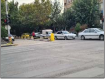
در خمیان شهید بهشتی دقیقاً چه می گذرد؟!

عملیات عمرانی برای زیرسازی آسفالت در این خمیان است. حمید آقایی اظهار کرد: طبق غربی این خمیان به دلیل فرونشست ناشی از ایجاد تأسیسات شهری و تخریب آسفالت آن در ترمیم و روکش کاری است. وی درباره افزودن خط پی از تی به خمیان شهید بهشتی گفت: در حال حاضر سرعت میر تی آری تی از میدان جمهوری تا پل فلزی به عرض ۲/۵ متر موجود است و مسیر متقابل آن مشترک با ترافیک عبوری از جنوب به شمال. خط پی از تی خمیان شهید بهشتی را تکمیل می کند.