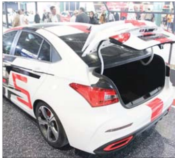
هفدهمین نمایشگاه صنعت خودرو با حضور ۶۱ مجموعه و جمعی از مدیران استانی بخش‌های سرمایه‌گذاری استانداری و خدمات شهری شهرداری اصفهان از روز سه شنبه در محل برگزاری نمایشگاه‌های بین‌المللی استان کار خود را آغاز کرد. این نمایشگاه به مدت چهار روز و در بیش از ۱۱ هزار متر فضای مسقف و ۴۰ هزار متر فضای باز با

در این دوره ۷۴ شرکت خارجی از کشورهای نظیر روسیه، چین، هند، آلمان، بلاروس و کانادا، امارات و افغانستان حضور دارند.