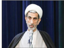
۵۷۰۰ دادگاه آنلاین در مهر ماه برگزار شد

حقالق رساند. رئیس کل دادگستری استان افزود: انجام ۴۵۲ مورد ملاقات الکترونیک زندانیان از دیگر اقدامات در این حوزه است. جغرفی ضمن تقدیر از تلاش‌های پرسنل معاونت فناوری اطلاعات و برنامه ریزی دادگستری کل استان تأکید کرد: در راستای ارتقای کیفی و کمی عملکرد، اقدامات حوزه و جامعه‌های قضایی سراسر استان به طور مستمر تحت نظارت و پایش بوده و ضمن تقدیر از حوزه‌های برتر، تذکرات لازم برای پیشرفت کمی و کیفی داده می‌شود.