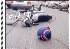
مرگ ۱۱۲ موتورسوار طی ۶ ماه در اصفهان

رئیس پلیس راهور استان اصفهان گفت: ۱۱۲ راکب موتورسیکلت در حوادث رانندگی استان طی نیمه نخست اسامال جان باختند. سرهنگ اسفندیار افراسیاب‌نژاد در بررسی‌ها و تجزیه و تحلیل‌های کارشناسی که بر روی حوادث فوتی استان اصفهان طی نیمه نخست اسامال انجام شد، سهم تقصیر موتورسیکلت سواران جان‌باخته در سوانح رانندگی ۵۲ درصد بوده است. وی افزود: در تصادفات فوتی ۶ ماهه اول سال جاری ۱۱۲ راکب موتورسیکلت و معادل ۵۲ درصد تصادفات سهم تقصیر داشتند. ۱۰۲ نفر سایر کاربران ترافیکی به میزان ۴۸ درصد سهم تقصیر در تصادفات منجر