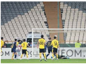
سپاهان با پیروزی بزرگی به مهم‌ترین دیدار فصل رسیده و همین موضوع می‌تواند به مانند شمشیر دو لبه برای این تیم باشد. در روزهای پایانی ماه سال گذشته بود که سپاهان در یک دیدار خانگی و پر سر

و صدا به مصاف زینت روسیه و ستاره‌هایش رفت و در پایان موفق شد با پیروزی ۲ بر یک از این مسابقه خارج شود. همه چیز در این مسابقه برای سپاهانی‌ها خوب پیش رفت و آنها برای بازی مقابل پرسپولیس در جام حذفی و شکست این تیم در خانه بسیار امیدوار بودند. اما چند روز بعد در ورزشگاه نقش جهان سپاهانی‌ها شکست غیرمنتظره و سنگینی را متحمل شدند و با نتیجه ۴ بر ۲ از جام حذفی کنار رفتند. پس از کنار رفتن سپاهان از جام حذفی و شکست مقابل رقیب دیرینه این بحث ایجاد شد که شاید اگر آنها در آن مقطع فصل به مصاف زینت نمی‌رفتند و غرور پیروزی مقابل این تیم بازیکنان تیم را نمی‌گرفت، نتیجه شاید طور دیگری رقم می‌خورد. حالا و در آستانه بازی سپاهان و پرسپولیس که روز یکشنبه هفته پیش رو از ساعت ۱۶:۳۰ دقیقه در ورزشگاه نقش جهان برگزار خواهد شد، بار دیگر این نگرانی میان سپاهانی‌ها ایجاد شده و آنها که پیش‌ازاین مقابل الملیق بزرگ‌ترین پیروزی تاریخ یک تیم ایرانی در لیگ قهرمانان آسیا را ثبت کرده، بیم آن دارند که بار دیگر این غرور در روزهای که پرسپولیس هم برای بازگشت به دوران اوج تحت فشار است. کارشناسان مهدو و شرایط را به مانند اتفاقات پس از دیدار برابر زینت رقم بزنند.