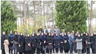
عضو کارگروه جهت انجام آزمون های ریزآلاینده های آلی و معدنی و نظارت دقیق بر کنترل کیفیت آب و پساب و تاملات با مراکز بهداشت در استان ها تاکید نمود.

ریزآلاینده های آلی و معدنی و نظارت دقیق بر کنترل کیفیت آب و پساب و تاملات با مراکز بهداشت در استان ها تاکید نمود. گفتنی است در این نشست دو روزه برنامه های اجرایی کارگروه در خصوص مقایسه بین آزمایشگاهی برای آزمون های فیزیک و شیمیایی و فلزات سنگین، برگزاری دوره های آموزشی برای کارشناسان مراکز پایش با استفاده از ظرفیت تدریس اعضای کارگروه، معرفی داخلی آزمایشگاه های کارگروه توسط کارشناسان مستعد و خیره استان های عضو کارگروه، نظارت های کارشناسان کنترل کیفی در میابوت توسط بهداشت آب و استانداردهای پساب توسط مدیران عضو کارگروه تهیه و تصویب شد.