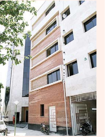
ادامه از صفحه قبل...

اما انطور که مشخص است بیش از یک جابه جایی بوده و من خودم این موضوع را لمس کردم چرا که برای ورود شماره ملی از شما گرفته می شود و یا باید کارت خیر نگاری داشته باشید و توضیحات متفرقه دیگری تا بتوانید به مجتمع ورود پیدا کنید. هم این هم برای امنیت خودماست چون الان ساختمان بسیار مهم است و روزی قریب به ۱۵۰ خبرنگار در آن رفت و آمد دارند نمی شود که در باز باشد که کسی اجازه ورود داشته باشد. در اینجا واحدی هست که خانم ها تنها کار می کنند اگر یک نفر بدون نظارت و بدون هر اثری میماند چه کسی باید پاسخگو باشد؟ این مجتمع قانون و قاعده دارد و من باید به اطلاع شما برسانم که هر کسی وارد شود دیگر امنیت نداریم. الان ورود به شکل رسمی است ضمن اینکه هر کسی از بیرون می آید به این نتیجه می رسد که اینجا کار دارد و نکته دوم اینکه کلوسر ما به شرایط خاصی قرار دارد و همانطور که می دانید گروه های تورستی تا دل خنجر هم ورود کردند و حالا مجموعه مطوعاتی که قرار است طرح های که داشته و دارم سر و صدا کند طبیعتاً باید منتهی هم حفظ شود. طبق بهتر نتیجه اینها شفاف سازی شود تا ذهنیت ها از روی شما برداشته شود؟ خبرنگار: این موضوع را چه می بینید؟ اما موضوع اینجا نیست من فریاد زبهر اگر کسی دلیل بیاورد پاسخگو بودم. نه به شکل خبری و نه به شکل رسمی اما هر وقت که این اتفاق می افتد است. اما موضوع اینجا نیست که باز خورد خوب نباشد و بیخ هم چ زیاد است.