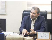
ارزش های حماسه ۲۵ آبان به نسل جدید منتقل شود

در صورت لزوم برای حفظ جان شهروندان اقدام کنند، افزود: به خدمت پلی باقی تیم خودروبی و تراکم جمعیت