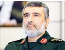
کسی نمی‌تواند ما را تهدید کند