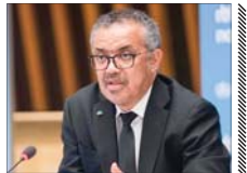
بیمارستان های غزه محل مرگ و ویرانی شده است