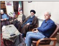
جلسه آبی مدیران ارشد با نماینده ولی فقیه در استان

در مجلس شورای اسلامی، اعضای شورای اسلامی شهر، شهردار اصفهان، معاون عمرانی استانداری، آیت‌الله مهدوی امام جمعه وقت اصفهان و عضو مجلس خبرگان رهبری مهلتات جلسه شهر اصفهان و استان برگزار شد. در جلسه روز شنبه مدیران شهری که با حضور نمایندگان مردم اصفهان برگزار شد، اعضا با تأکید بر پیگیری مطالبات مردم، به طرح دیدگاههای خود در خصوص زاینده رود، طرح‌ها و پروژه‌های مختلف برای حل مشکل زاینده رود پرداختند. همچنین مدیران شهری و نمایندگان اصفهان در مجلس با حضور در بیت آیت‌الله، سید ابوالحسن مهدوی از اعضای مجلس خبرگان رهبری با وی دیدار و گفتگو کردند. پس از این دیدار نیز جلسه مشترک نمایندگان کار مردم اصفهان و گفتگو شد.