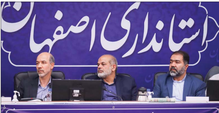
مهران موسوی خونساری

نطق مهم رئیس شورای شهر اصفهان در جلسه روز گذشته این شورا، نمایی روشن از جلسه وزاری نیرو و کشور با مدیران ارشد استان اصفهان را فاش می کند. به استناد اظهارات محمد نورالحی، سفر احمد وحیدی و علی اکبر محرابیان به استان اصفهان در فضای پرتنش اما با اظهار امیدواری به حل مشکلات عمیق آبی در استان اصفهان به پایان رسیده است.