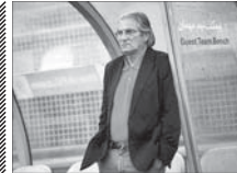
پایان ترس و شروع کابوس برای پرسپولیس

پرونده طولانی پرسپولیس و «ماتولت ژوزه» به مراحل پایانی نزدیک می‌شود و فیفا به زودی، رای نهایی درباره آن را اعلام می‌کند. شکایت ژوزه از پرسپولیس برای گرفتن دستور دادخواست خلع ید و جریمه، با موافقت فاف همراه شده و فیفا شکایت پرسپولیس از سرمربی سابقش را رد کرده است. رای نهایی این پرونده، نهایتاً تا دو ماه آینده اعلام خواهد شد و پرسپولیس، ها زمان زیادی برای پرداخت حدود ۷/۵ میلیون دلار به سرمربی سابقش نخواهد داشت. زمان اعلام رای نهایی برای پرونده ژوزه، به روزهای پایانی لیگ شازدهم نزدیک است و پرسپولیس، بودجه