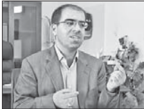
جراحی زنان و زایمان در صدر پرونده‌های قصور پزشکی

اصفهان را تشکیل می‌دهند، افزود: از کل مراجعان نزاع شده‌ده هزار و ۱۵۶ نفر زن و ۲۱ هزار و دو نفر مرد بوده‌اند. مدیر کل پزشکی قانونی استان ضمن دلیل نشان کردن آذر ماه سال جاری نیز دو هزار و ۳۹۵ نفر به دلیل صدمات ناشی از نزاع به مراکز پزشکی قانونی استان مراجعه کرده‌اند که نسبت به آذر ماه سال گذشته حدود ۷۷ درصد کاهش داشته است. وی تصریح کرد: بیشترین پرونده‌های مطرح‌شده در موضوعات قصور پزشکی به ترتیب در رشته‌های جراحی زنان و زایمان و نازایی، جراحی عمومی و دندانپزشکی بوده است. پرونده‌های مرتبط با قصور پزشکی در مقایسه با مدت مشابه سال قبل ۱۱ درصد کاهش داشته است.