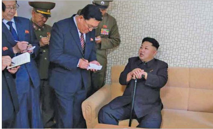
کره شمالی که از زمان تأسیس در سال ۱۹۴۸ توسط متحد مجازات شده است. شدیدترین تحریم های اعمال شده بر ضد پیونگ یانگ توسط شورای امنیت به مارچ سال گذشته بر می گردد. شورای امنیت سازمان ملل متحد در این تاریخ در

آخرین رهبر اتحاد جماهیر شوروی در ادامه به مشکلات اجتماعی نیز اشاره کرده و می نویسد: در حالی که بودجه های دولتی برای پوشش نیازهای اساسی اجتماعی مردم با مشکل مواجه هستند هزینه های نظامی افزایش می یابند. به راحتی برای تولید تسلیحات پیچیده ای که قدرت تخریب آنها با تسلیحات کمتتر جمعی برابری می کند پول هزینه می شود برای زیردریایی هایی که می توانند به تنهایی نیمی از یک قاره را نابود کنند و با برای