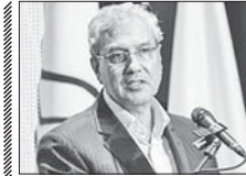
۲۳ درصد افراد جامعه دچار ناامنی روانی هستند

مدیر عامل ستاد دیده کشور با اعلام جمعیت ده هزار و ۵۱۱ نفری زندانیان جرائم غیر عمد، گفت: در تفکیک این آمار محکومان مالی، ۸۰ درصد آمار عددی را خود اختصاص داده اند. سید اسدالله، جویای با اشاره به آمار موجودی زندانیان جرائم غیر عمد اعلام کرد و گفت: زندانیان چک های لامحل قانون دیده بیمه اجباری شخصی کالک آمار زندگان زندانی ناشی از تصادفات به ۸۰۰ نفر تقلیل پیدا کرده است که این رقم در روزهای آتی نیز به مرور کم خواهد شد. وی بهدکاران مالی را بیشترین طیف زندانیان جرائم غیر عمد اعلام کرد و گفت: زندانیان چک های لامحل به شش هزار و ۸۴۵ نفر بیشترین محکومان غیر عمد را خود اختصاص داده و در آن دسته از مدعوین تحت حمایت ستاد دیده استان های فارس با ۶۵۰ محکوم، گیلان با ۵۳۸ مدعو و اصفهان با ۳۴۵ محکوم به ترتیب بیشترین آمار محکومان را خود اختصاص دادند. وی با اعلام آمار آلوده دارو، از ۱۲۰ نفری زندانیان بهره گفت: اگرچه طبق قانون خانواده با صافی بالای ۱۱۰ سکه رفعا و آن را از خود دور نگذاریم. ادامه داد: در حال حاضر از حدود هفت میلیارد نفر در جهان، شش میلیارد نفر به تلفن های همراه دسترسی می یابند.