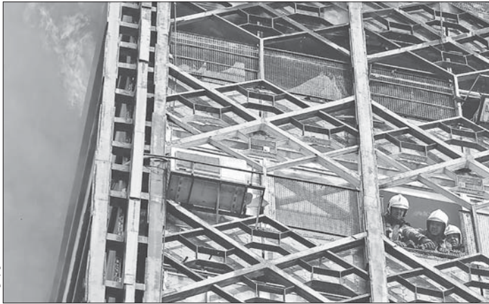
مکانی از پیش است

وزیر تعاون، کار و رفاه اجتماعی گفت: ۲۳/۴ درصد از افراد ۱۵ تا ۶۴ سال در طیفی از ناامنی روانی قرار دارند اگر این درست باشد، یعنی از هر پنج نفر یک نفر در این طیف است. به گزارش مهر، علیرضا ربیعی در مراسم افتتاح مرکز مشاوره تلفنی ۱۴۸۰ با بیان اینکه امروزه نیاز به مشاوره بیش از هر زمانی احساس می شود، افزود: براساس مطالعات حدود ۵۳ درصد از غل مرگ و میر به شیوه روانی، ۲۱ درصد به عوامل بهداشتی، ۱۶ درصد به وراثت و ۱۰ درصد به مسائل بهداشتی مربوط است و به طور کلی می توان گفت ۷۳ درصد از