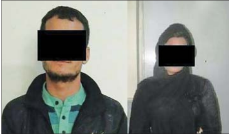
فرمانده انتظامی استان خراسان رضوی از دستگیری زن و شوهری که با جعل هویت و اسناد اقدام به کلاهبرداری چهار میلیارد ریالی کرده بودند، خبر داد.

به گزارش میزبان، سردار بهمن امیری مقدم گفت: در پی مراجعه شهروندی با دست داشتن مرجوعه قضائی مبنی بر اینکه با خرید ملکی در یک بنگاه املاک، هممه کلاهبردان حرفه ای شده است تحقیقات گسترده کارآگاهان پلیس آگاهی استان آغاز شد. وی افزود: با توجه به اهمیت موضوع کارآگاهان مبارزه با جعل و کلاهبرداری پلیس آگاهی رسیدگی به این پرونده را آغاز کرده و در تحقیقات اولیه دریافتند این پرونده چند شاکی دیگر نیز دارد.