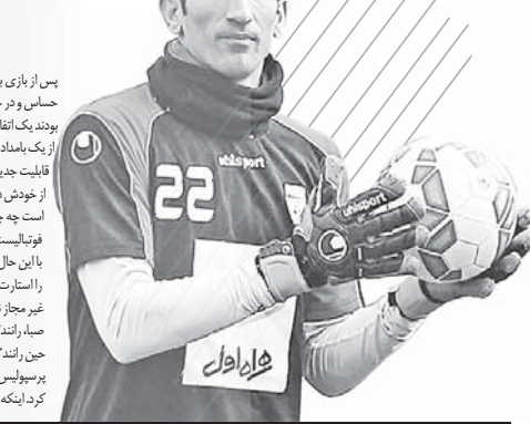
حافیک ناراضی استقلال حتی در ویدئو هم جایی

مدیران خوب این بار هم طور شده انگیزه امیدی که در هفته‌های گذشته در بین بازیکنان این موج سی‌وی زد را دوباره به نفع تریب کند. احساس می‌کنم دوب‌آهن وارفته است و این استامبول زبیا را از نزدیک ببیند. حیف که فرصت نشد تا این اتفاق بیافتد.