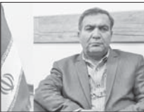
عامل تغییر وضعیت صنعت خودمان هستیم

شهر اصفهان هستند که به دلیل تفاوت فرهنگ‌های مختلف و حجم جمعیتی زیاد، میزان حجم اسپب و شمار معتمدان در آنها بیشتر است. ناجی ادامه داد: در حال حاضر صد کعبه ترک استیاد اقامتی میان مدت تحت پوشش پرهزستی و ۶۲ کلینیک سربازی ترک اعتیاد در استان اصفهان فعال هستند. معاون پیشگیری اداره کل پرهزستی استان اصفهان افزود: طبق آمار اعلام شده از سوی شورای هماهنگی مبارزه با مواد مخدر استان اصفهان، حدود ۹۰ هزار نفر معمار در سطح استان وجود دارد که بیشترین آنها مردان در رنج سنی ۲۵ تا ۳۵ سال هستند.