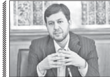
بهرمرداری از فاز ۳ قطار شهری در سال آینده

امام حسین (ع) تا دو ماه آینده افتتاح شود زمان طی مسیر خط از ۲۰ دقیقه به ده دقیقه کاهش پیدا می‌کند. شهردار اصفهان با اشاره به فاز سوم خط یک قطار شهری گفت: فاز سوم از ایستگاه تختی تا ایستگاه دفاع مقدس در نیمه نخست سال ۹۶ به بهره‌برداری می‌رسد و چند ایستگاه مهمی که در راه اندازی نخست باید سرویس دهی کنند به‌خوبی کار خود را انجام می‌دهند. وی اضافه کرد: عملیات عمرانی ایستگاه دروازه شیراز و میدان آزادی نیز به‌سرعت در حال انجام است که تا پایان سال به بهره‌برداری می‌رسد.