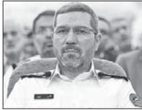
آغاز طرح نوروزی پلیس از اسفند ۲۵