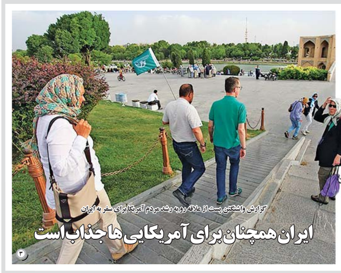
گزارش واشینگتن پست از طلاق رو به رشد مردم آمریکا برای سفر به ایران ایران همچنان برای آمریکایی ها جذاب است