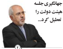
جهتگیری جلسه هیئت دولت را تعیین کرد...

مدیر یک شرکت ایتالیایی در دیدار با مدیرعامل صندوق احیا و بهره برداری از اماکن تاریخی و فرهنگی اعلام کرد اگر پروژه احیای کاروانسراهای مسیر کرمانسار-اصفهان کلید بخورد، شرکت «ال-ای-جنسیس» آمادگی دارد مرمت مسعودیه را به صورت رایگان انجام دهد.