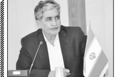
بزرگراه‌های استان اصفهان آزادراه می‌شوند