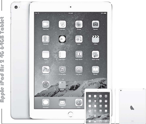
Apple iPad Air 2 4G 64GB Tablet

میزان انعکاس نور محیط در آن یکبارده چینی بهبودی خواندن و مشاهده صفحه نمایش در روز و نور زیر آفتاب را انسان تر خواهد کرد. اما گذشته از دارا بودن کمترین میزان خنک شدن در طول فرآیند شارژ شدن، «هایرکیت تبلت نیند» یاد می کند. شما همدم بهترین ویژگی جدید اپل در جدید در اضافه شدن تاچ آئی دی باشد. این نخستین باری است که اپل، فناوری تاچ آئی دی خود را در روی تبلت قرار می دهد و حالا نهمه دهندگان می توانند از آن در انواع برنامه ها چون برنامه های خرید و فروش، امینتی و دیگر موارد استفاده کنند. اپل همچنین می گوید که استفاده از تاچ آئی دی در آی پد ایر ۲ می تواند به شما در خریدهای درون برنامه ای خرید اجناس فیزیکی کمک کند. اپل نورسین اپل را نیز به شکل قابل ملاحظه ای ارتقا بخشیده است. سحرگر عیب این تبلت حالا «مگاپیکسل شده و دارای درجهی دیاگرام F2.4 است. این نورسین قادر به ثبت ویدیوهای