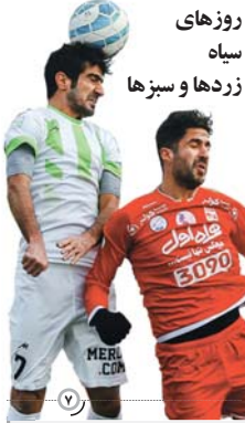
روزهای سیاه زردها و سبزه ها