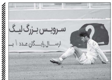
سرویس بزرگ لیگ ارسال ایسکان عدد ۱۱

ششانی به پیش می است. همچنین با جدیدترین تصمیمات اتخاذ شده، آنها قرار است از امروز به تهران بروند و سایر جلسات تمرینی خود قبل از دیدار با پرسپولیس را در پایتخت برگزار کنند. این تصمیم سپاهانی ها با توجه به اینکه دیدار با سرخوشان را روز پنجشنبه برگزار می شود، بسیار عجیب به نظر می رسد. اظهار آنها پس از پناهندگی به صفائی، درمصدن در مرحله دوم این پروژه کاملاً دور از اصفهان باشند و خیانتان از باب اعتراضات احتمالی هواداران کاملاً راحت باشد.