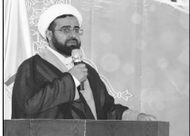
برگزاری آزمون کتبی حفظان قرآن به صورت الکترونیکی

۲۶ هزار و ۵۰۰ نفر در آزمون شفاهی ای طرح شرکت می‌کنند. وی افزود: دوره مرحله دوم این دوره نیز همزمان با سراسر کشور و در پنج رشته ۱۸ ماهه به مدت ۱۲۸ حوزه فرعی و اصلی استان اصفهان در ۱۰ حوزه امتحان برگزار می‌شود. برخی مدارس برپاست اجتماعی می‌شود. معاون فرهنگی و اجتماعی اداره کل اوقاف و امور خیریه استان اصفهان گفت: برگزاری این مسابقه در استان اصفهان برای اولین بار در کشور توانسته است مستقیم انگیزشی را برای برکازی آزمون‌کنی ای طرح فراهم کند.