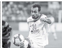
داور می توانست پناالتی نکیرد

بود و بارها شده که ضرایب اینجینی، حتی از فاصله دورتر بازیکنان تیم سازه اند اما داور آنها را پناالتی نگرفته است. من به داور هم گفته ضرایب بدتر از این برای ما پناالتی نگرفته اند چطور هم سازه این توپ را که فاصله می متری به دست بازیکن ما خورد در پناالتی اعلام می کند.