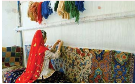
نصف جهان آثار تاریخی و هنر دست زنان خالد آبادی شهرت ملی و جهانی پیدا کرده است.