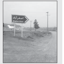
اصغر آباد از پاک ترین شهرهای زیست محیطی اطراف اصفهان است

اصغر آباد از پاک ترین شهرهای زیست محیطی اطراف اصفهان است.