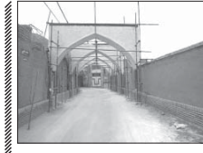
اعطای وام ۵۰ میلیونی برای احیای بافت فرسوده کاشان