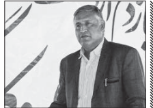
گلاب قصر استاندارد سازی می شود

مجربو به اسکان اضطراری و اقامت موقت در اصفهان خواهند بود که فجاورستان در این حوزه می تواند به خوبی وارد شود. وی با اشاره به اینکه آلودگی داریم از سرمایه گذاری که بتواند در حوزه گردشگری در فجاورستان سرمایه گذاری کند، استقلال و زمینه فراهم کنیم، ادامه داد: فجاورستان ظرفیت بالایی در حوزه گردشگری دارد. صادقان در بخش دیگری از سخنانش با اعلام اینکه شرکت برق شهرستان وعده داده است تا در حوزه روشنایی فجاورستان ورود جدی پیدا کند، اعلام کرد: فجاورستان رو به پیشرفت است و تلاش های زیادی برای آسائات و همچنین فاصلاب کشی برای مسکن مهر صورت گرفته است.