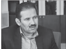
میدان امام (ره) میزبان بازی چوگان می‌شود