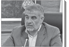
آمانگي سپاه برای بارور کردن ابرها