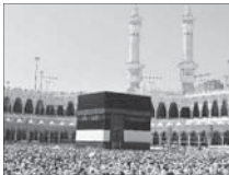
ثبت نام کاروان های حج ۹۶ آغاز شد