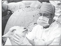
ضرورت برنامه ریزی برای مقابله با تب کریمه کنکو

به بازنده های اخیر و نزدیک شدن به فصل گرما نیاز است تا برنامه ریزی های لازم جهت پیشگیری از بروز و اقدامات ضروری از زمان بروز صورت گیرد. مودی در خصوص گسترش دامه، تصریح کرد: به مسئولان فنی بهداشتی کنترل کارگاهها اعلام شده که از گسترش دامه های که روی بدن آنها کته مشاهده می شود خودداری شود و دامه های مذکور به محل مشخص انتقال داده و تا سمپاشی و گذراندن دوره ۱۴ روزه قرنطینه ای برای این گونه دامه اعمال شود. همچنین در صورت خرابی بیش سرمد و با نظریات بالای کنترلکار، کنترل کارگاهها از انتشار دامه جلوگیری کنند.