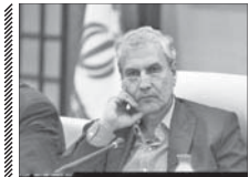
سابقه بیمه روستائیان برای باننشستگی، ۱۰ سال شد

رئیس سازمان حج و زیارت از آغاز ثبت نام در کاروان های حج تمتع در سراسر کشور خبر داد و گفت: ثبت نام در کاروان های حج تمتع امسال به صورت همزمان در همه استان ها از ساعت ۹ صبح روز یکشنبه (پرواز) آغاز شده است. حمید محمدی در خصوص زمان اعلام کاروان های حج افزود: همه واجدین شرایط تشریف به حج امسال که از ۲۳ فروردین تا ۲۱ اردیبهشت با مراجعه به شعب بانگ ملی ملی ثبت نام اولیه تشریف به حج اقدام کرده اند، می توانند با مراجعه به