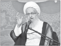
آیت... مکارم از هیچ نامزدی حمایت نمی کند

جنگ در ایران با فتون رزمی آشنا شده است، بعدها پس از سرنگونی «حامد حسین» دیکتاتور عراق به این کشور رفته و حالا در سوریه است و همچنان ۳۷ سال پس از انقلاب ایران مشغول رزم است.