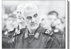
قاسم سلیمانی قوی ترین مرد خاور میانه است

روزنامه معتبر «لوموند» چاپ فرانسه در تازه ترین شماره خود در صفحه نخست مطلبی با عنوان «قاسم سلیمانی، چهره‌گرایی ایرانی‌ها» منتشر کرده است.