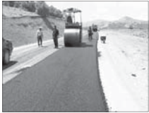
تخصیص ۱۱ میلیارد برای راه های روستایی