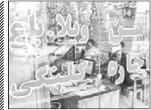
افزایش ۱۶ درصدی هزینه های اجاره مسکن در اصفهان